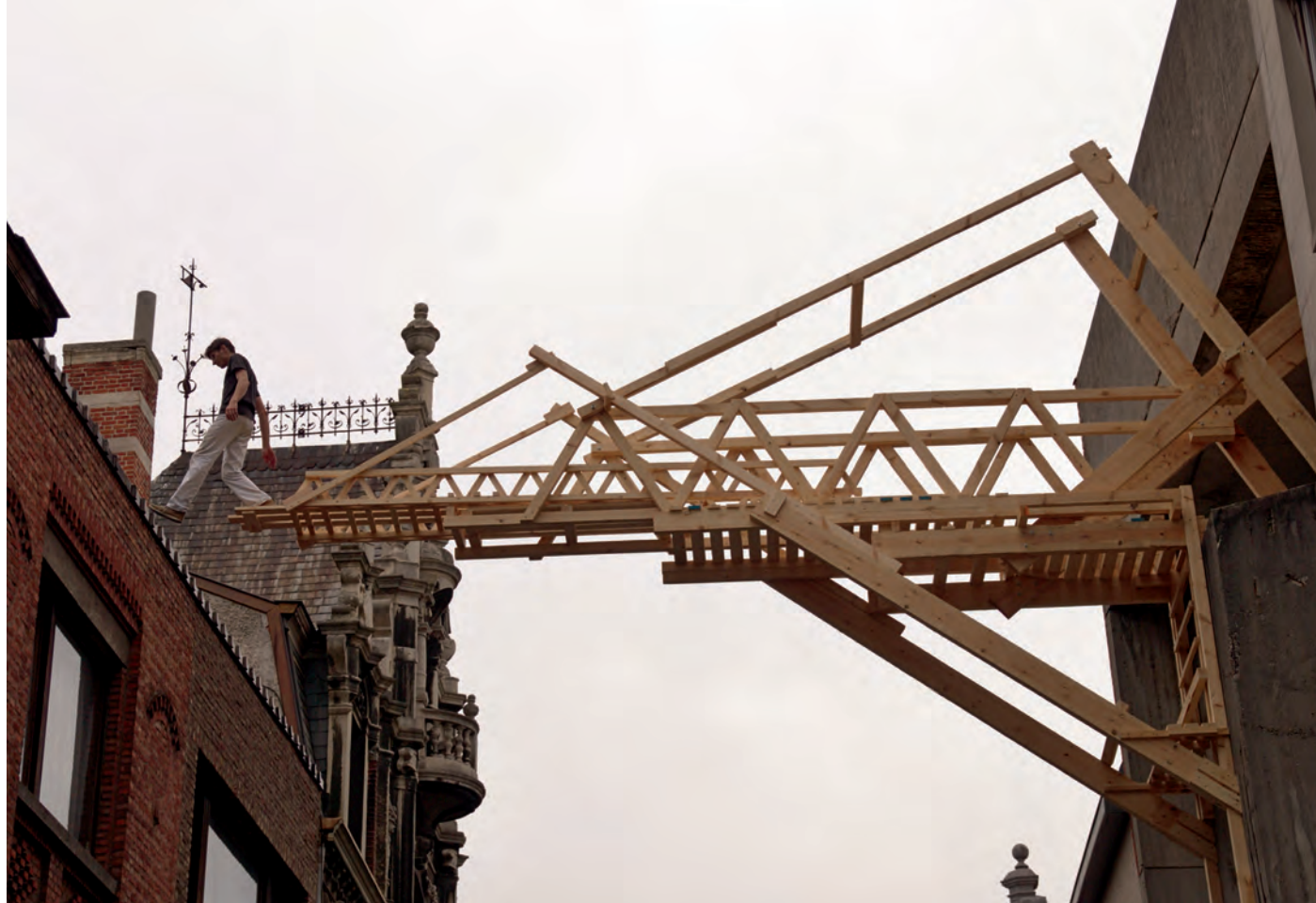
Adrien Tirtiaux, Bruggenbouwen, Coup de ville 2013