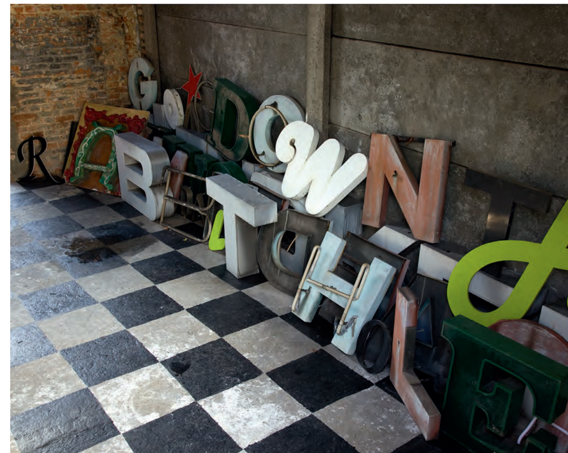
Kelly Schacht, Coup de ville 2010