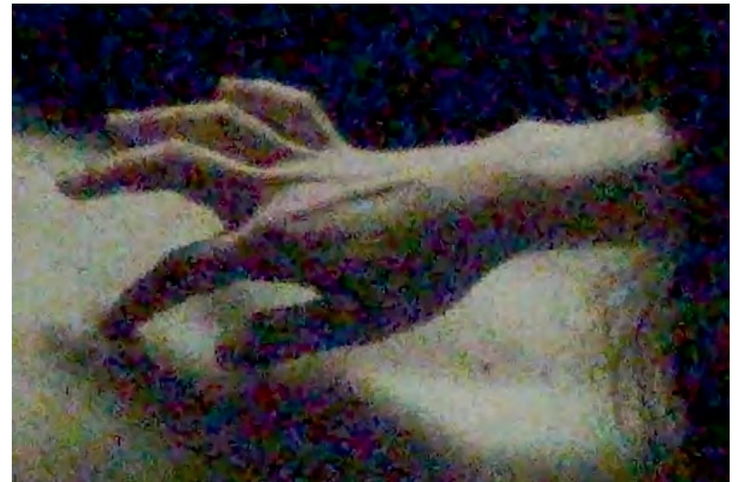
Sylvie De Meerleer, video performance op Coup de ville 2016