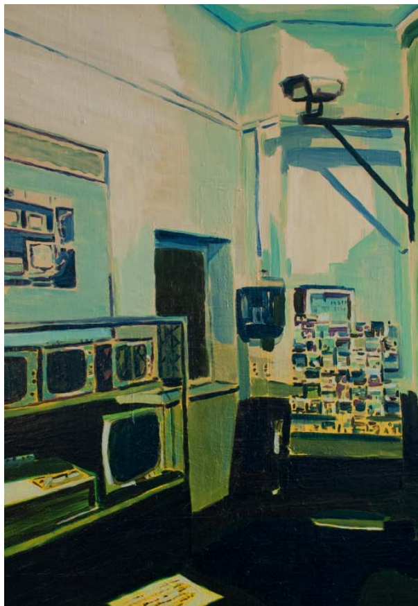
Colin Waeghe, Framing (Nobody but you) , 2014, 70 x 100 cm

INFO – WEBSITES http://www.galeriezwarthuis.be/colinwaeghe/