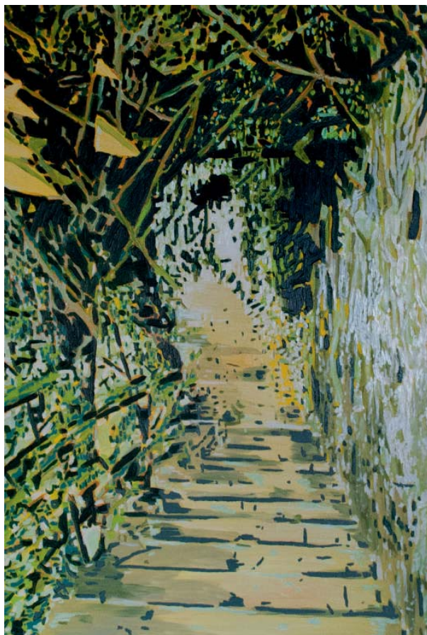
Colin Waeghe, Underground , 2015, 100 x 70 cm