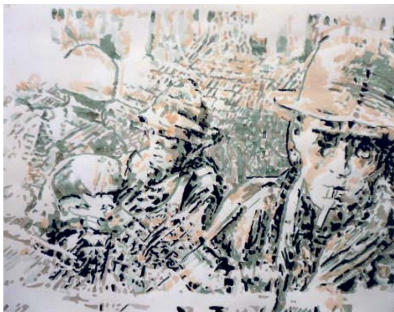
Colin Waeghe, Tim Page (Alternator) , 2011, 50 x 65 cm

door het schilderen als zodanig terug bij de inhoud terecht. Ik wilde geen prentje maken bij de idee. Ik vroeg me dus af hoe dat te vermijden was. De idee moest mee door de vorm tot stand komen.”