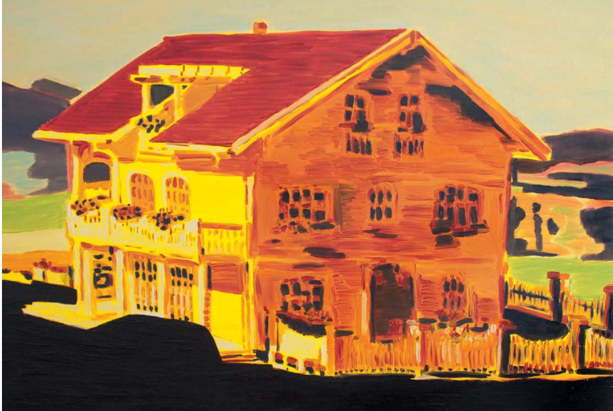
Colin Waeghe, Recreation (Nobody but you) , 2014, 70 x 100 cm