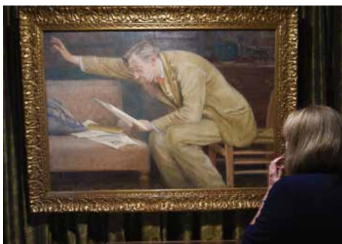
Constant Montald, La Lecture , 1908 EMILE VERHAEREN MUSEUM, SINT-AMANDS

Tot 27 november loopt de expo Emile Verhaeren, een dichter voor Europa in het Emile Verhaeren Museum in zijn geboortedorp Sint-Amands. Let op het grote portret van een debiterende Emile Verhaeren. Een anoniemus kocht in juni La Lecture van de hand van Constant Montald (1862-1944) en schonk het aan het museum.