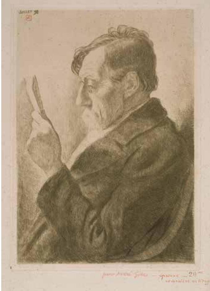
Theo Van Rysselberghe, Portret van Emile Verhaeren, lezend, 1898, ets MUSEUM VOOR SCHONE KUNSTEN, GENT

Op 27 november 1916 verloor de dichter en kunstcriticus Emile Verhaeren (1855 – 1916) het leven bij een treinongeluk in het station van Rouen. De wereld verloor daarmee niet enkel een in het Frans schrijvende Vlaamse woordkunstenaar van wereldformaat, maar ook een begenadigd criticus en voorvechter van de beeldende kunsten. Het Museum voor Schone Kunsten in Gent wijdt daarom een tentoonstelling aan Verhaerens leven in het teken van de kunst.