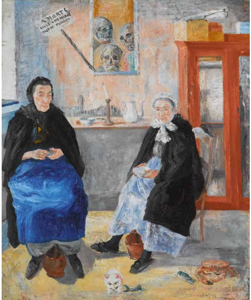
James Ensor, De melancholische viswijven , 1892 (voor het eerst te zien op de Verhaeren-tentoonstelling)

MUSEUM VOOR SCHONE KUNSTEN, GENT, © LUKAS - ART IN FLANDERS