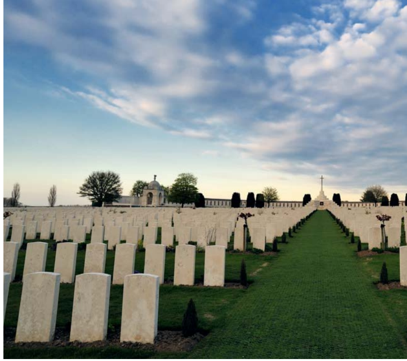
Tyne Cot Cemetery

Iets minder dan de helft van onze bezoekers is Engelstalig. De meerderheid ervan komt uit Groot-Brittannië. Een bezoek aan de slagvelden van de Eerste Wereldoorlog is onderdeel van het leerprogramma van Britse schoolkinderen. Ongeveer zeven procent van de Engelstaligen komt uit Australië, Nieuw-Zeeland en Canada, landen die niet in de buurt liggen, maar hun aandeel stijgt sinds 2015. Eveneens iets minder dan de helft van de bezoekers zijn Vlamingen. Van de overige tien procent zijn de helft Duitsers, die sinds vorig jaar wat beter de weg naar het museum hebben gevonden. Uit Frankrijk is de belangstelling beperkt. Dat land bezit zelf heel wat WOI-erfgoed. Uit Wallonië komen bijzonder weinig bezoekers.