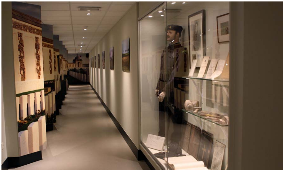
De herinneringsgalerij, gewijd aan de gesneuvelden en de nabestaanden

Het herdenkingsjaar 2007 was een enorme troef en meerwaarde voor de streek. Het museum had voordien al heel wat aandacht besteed aan de promotie naar de nationale en internationale markt. In 2007 konden we er de vruchten van plukken. Zonnebeke is toen definitief op de kaart gezet. In 2008 werden we een regionaal erkend museum en datzelfde jaar wonnen we de publieksprijs van de Museumprijs van Openbaar Kunstbezit Vlaanderen. Beide waren de bekroning van het aangehouden harde werk van de dynamische ploeg. Maar er werd niet op de lauweren gerust. In 2009 werd een ambitieus plan uitgetekend. Dat behelsde de inrichting van een museumtuin en de verlenging van de bestaande dugout met een nieuw, ondergronds museumgebouw. Beide openden in juli 2013. In de museumtuin wandelt de bezoeker nu door een netwerk van gereconstrueerde loopgraven en schuilplaatsen.