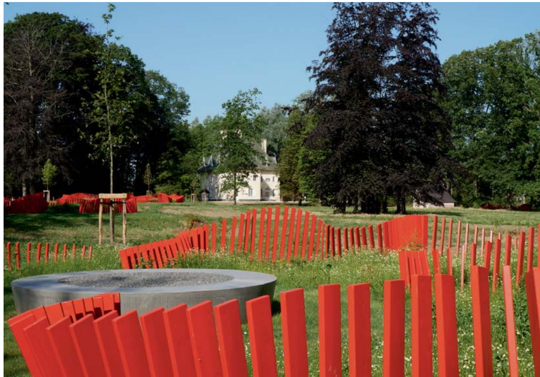
Deutscher Passchendaele Erinnerungsgarten