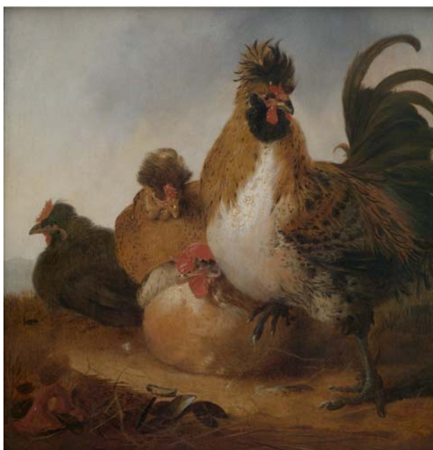
Aelbert Cuyp, Haan en hennen , ca. 1650, olieverf op paneel, 48 x 45,1 cm MUSEUM VOOR SCHONE KUNSTEN, GENT

INFO Tentoonstelling Nieuwe presentatie van de verzameling Noord-Nederlandse schilderkunst – Museum voor Schone Kunsten Open: dinsdag t.e.m. zondag van 10 tot 18 uur – Gesloten: maandag – Fernand Scribbedreef 1, Citadelpark, 9000 Gent, T 09 240 07 00, www.mskgent.be