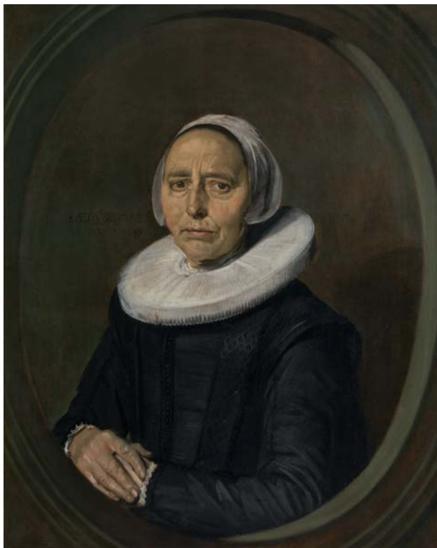
Frans Hals, Damesportret , 1640, olieverf op doek, 85,2 x 68,1 cm MUSEUM VOOR SCHONE KUNSTEN, GENT

De familie De Grebber was rooms-katholiek en allicht kreeg Pieter opdrachten voor altaarstukken in katholieke schuilkerken.