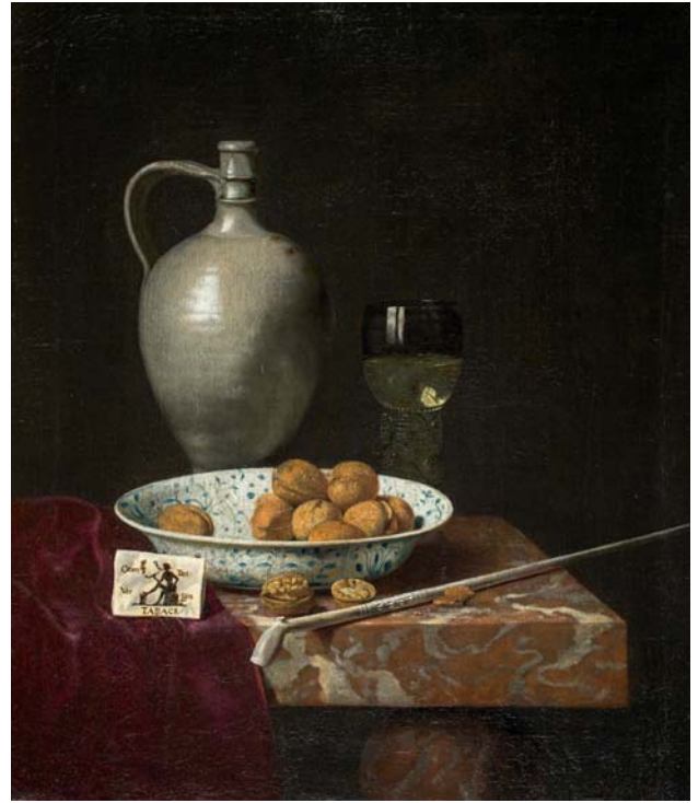
Hubert van Ravesteyn, Stilleven , ca. 1670, olieverf op doek, 52,2 x 44,6 cm: voor en na restauratie - MUSEUM VOOR SCHONE KUNSTEN, GENT