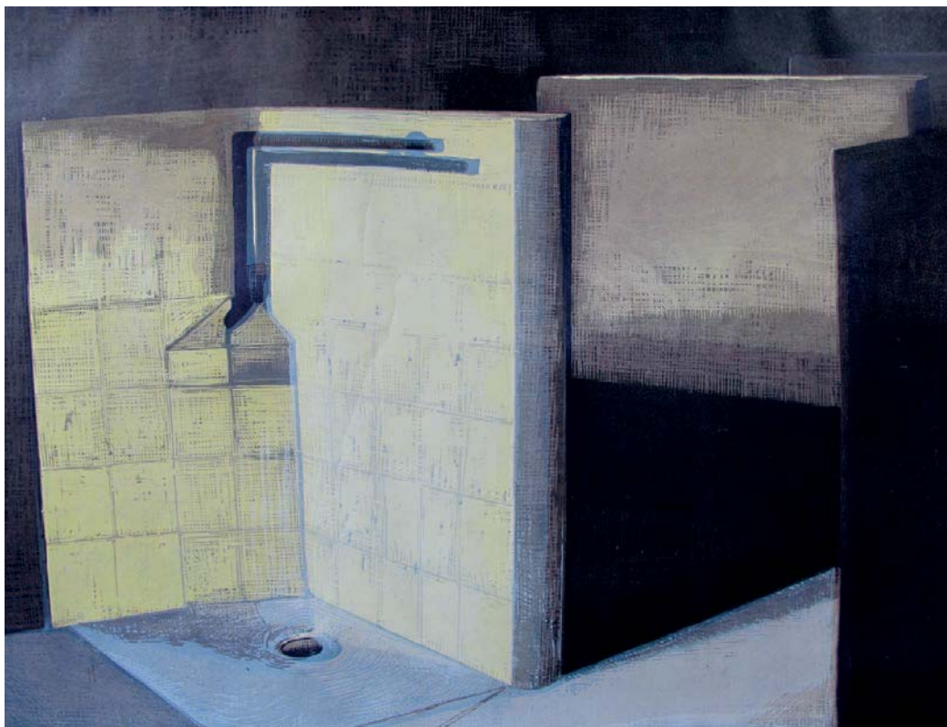
Goedele Peeters, Still Life IV , 2015, houtsneede, 70 x 95 cm