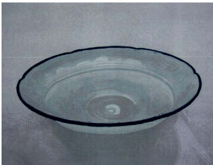
Goedele Peeters, Hold Me , 2010, houtsnede, 28 x 38 cm

De naam Goedele Peeters doet bij ingewijden zeker een belletje rinkelen, maar het grote publiek kent haar minder goed. Ze beweegt zich voornamelijk in het veld van de grafische kunsten en dat is vandaag een ondergewaardeerde discipline.