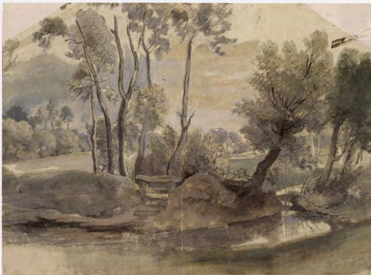
Peter-Paul Rubens, Landschap met een dam , ca. 1635, zwart krijt, gouache en tempera, gedoubleerd, 43,5 x 59 cm STATE RUSSIAN MUSEUM, SINT-PETERSBURG

vat de culturen van het oude Egypte, Mesopotamië, Byzantium, Iran, Centraal-Azië, de Kaukasus, China, Japan en India. Naast de Schone Kunsten is er ook plaats voor volkskunst, munten, wapens, boeken enz. Elk jaar bezoeken zo'n 2.5 miljoen mensen de Hermitage, waarmee het in de top twintig staat van de meest bezochte musea ter wereld. Nu hangen er dus zo'n 75 schilderijen uit die topcollectie in Amsterdam.