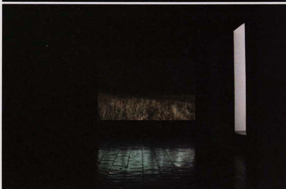
Outbound, HD-video, 09'23", 2006