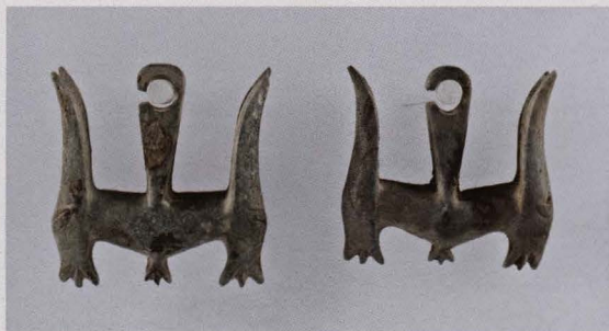
Paar oorsieraden gevonden in een grafurne, Sa Huynh-cultuur, centrum van Vietnam, 7de eeuw v. Chr. - 1ste eeuw n. Chr., nefriet Nieuwe aanwinst in september 2010 gerealiseerd dankzij financiële steun van de Kamer van Koophandel en Industrie België-Vietnam

Ook inhoudelijk zijn de collecties van Zuidoost-Azië opgefrist. Dankzij de steun van de Kamer van Koophandel en Industrie België-Vietnam kocht het museum in september 2010 een paar oorsieraden van de Sa Huynh-cultuur (ca. 7de eeuw v. Chr. - 1ste eeuw n. Chr.) Ze werden aangetroffen in een metershoge grafurne samen met resten van verbrande beenderen, ijzeren wapens en werktuigen en ornamenten in glas, jade en serpentijn. Het is erg zeldzaam dat beide oorringen in dezelfde urne zijn gevonden, meestal vindt men er maar één van. Met deze stukken in nefriet die tweehoofdige hertachtigen met lange hoorns voorstellen, wordt de collectie in het Jubelparkmuseum volgens conservator Miriam Lambrecht nog representatiever: "In de periode dat Vietnam van het Stenen Tijdperk naar de Bronstijd overging, ontstonden verschillende rijken en beschavingscentra: het Van Lang-en het Au Lac-koninkrijk met de Dong Son-cultuur in het noorden, het Champa-koninkrijk met de Sa Huynh-cultuur in het centrum en het Funan-koninkrijk met de Oc Eo-cultuur in het zuiden. Elk van deze drie rijken onderhield contacten met China en India. Onze verzameling heeft meerdere typerende en belangrijke voorwerpen van de Dong Son-cultuur, maar de oorsieraden vormen het eerste voorwerp in onze verzameling Vietnam van de Sa Huynh-cultuur."