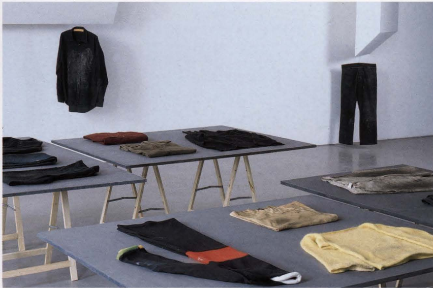
Rosemarie Trockel, Leben Heist Strumphosen Stricken , 1998 COLLECTIE FRAC AQUITAINE, BORDEAUX