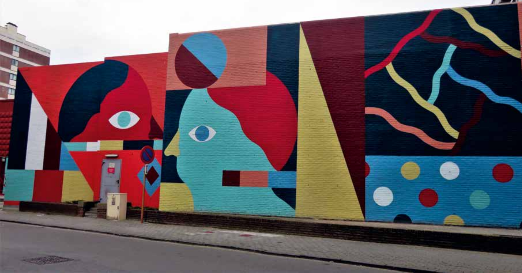
Hell'O, 2017, Oostende, Perronstraat, initiatief van The Crystal Ship