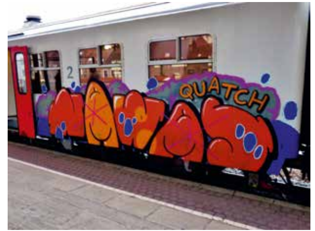
Nawas en Quatch samen op de trein © FERDINAND FEYS

rechts: Crayons-Idiot, Brussel, Sint-Gillis © FERDINAND FEYS