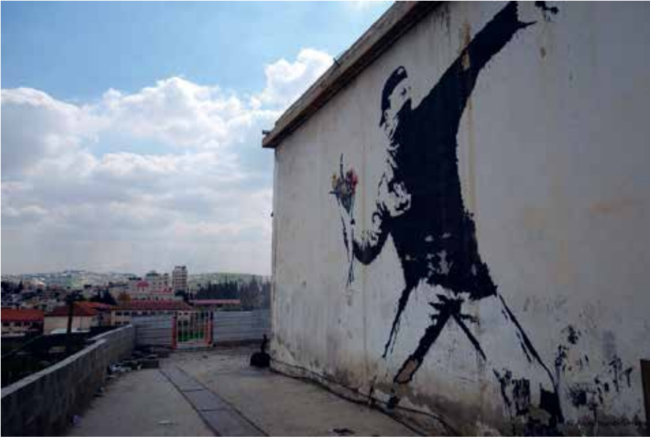
Banksy, De bloemengooier , Bethlehem

vormgeving, waardoor hij de kern van de commerciële kunstindustrie werd. Hij wendde zich al snel tot street art en maakte zijn typerende krijttekeningen in metro's, op straatlantaarns en andere gemakkelijk toegankelijke bouwwerken. Hij gebruikte zelfzekere vloeiende lijnen om kracht en eenheid weer te geven en later richtte hij zich op sociaal-politieke kwesties zoals AIDS om bewustzijn te verspreiden en debatten aan te wakkeren. Zijn kunst werkt vooral rond thema's als geboorte, liefde, dood en oorlog en belichaamt de tumultueuze jaren negentig waarin zijn werk tot stand kwam. Maar eigenlijk viel de term 'street art' voor de eerste keer tijdens de jaren zeventig en tachtig in New York, om de werken van bijvoorbeeld John Fekner en Jenny Holzer te beschrijven. John Fekner creëerde, door middel van spuitbussen en stencils, honderden werken die sociale, politieke en conceptuele boodschappen overbrachten in het straatbeeld. De feministische Jenny Holzer projecteerde poëtische zinnen en ideeën op gebouwen of stelde ze samen in ledverlichting. Een ander voorbeeld van vroege street art of proto-street art in de jaren tachtig is een collectief van illegale kunstenaars die onder de noemer Truth in Advertising werkten. Zij wilden op humoristische wijze de waarheid in advertenties blootleggen. Ook vandaag is dat trouwens nog een populaire manier om street art-interventies te maken.