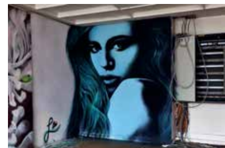
Kitsune, 2017, onbekende locatie