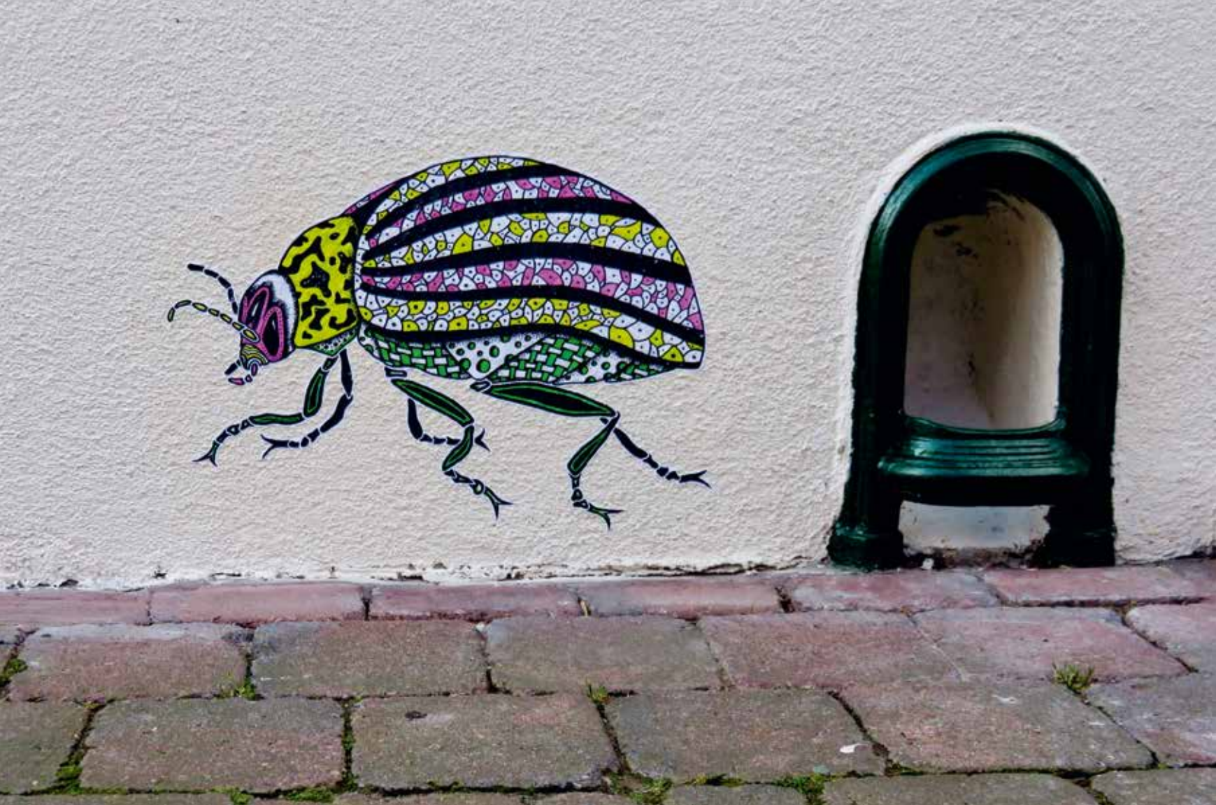
Jaune, 2017, Brussel, Arteveldestraat, initiatief van de Stad Brussel