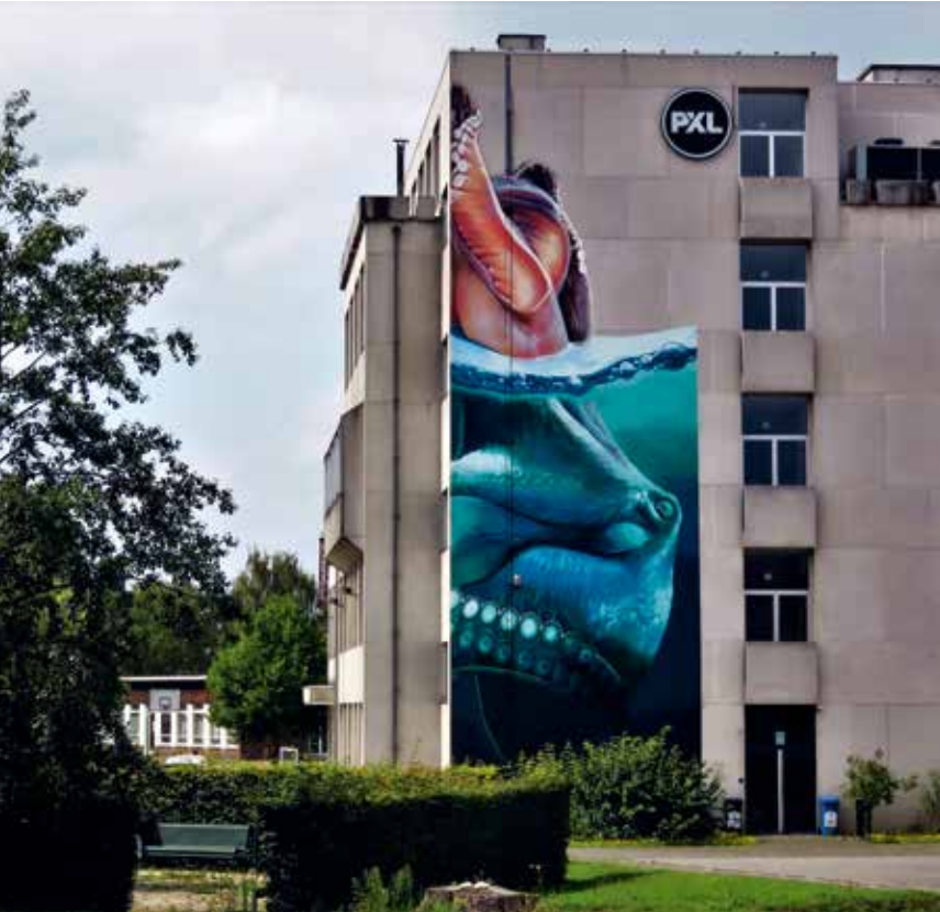
Smates, 2015, Hasselt, Elfde-Liniestraat, initiatief van Street Art Festival