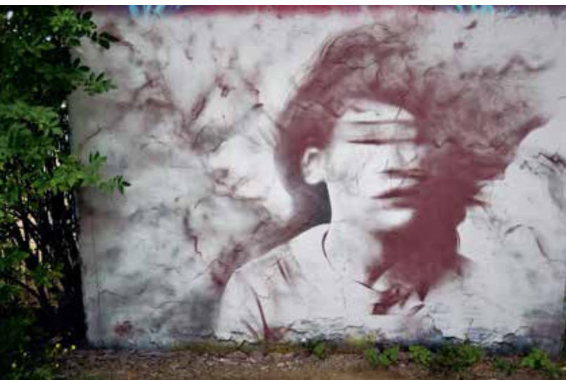
Caratoes en A Squid Called Sebastian, 2015, Gent, Kerkstraat (verdwenen)