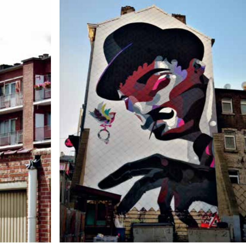
SozyOne, 2014, Luik, rue Nagelmaekers, initiatief van Paliss'art