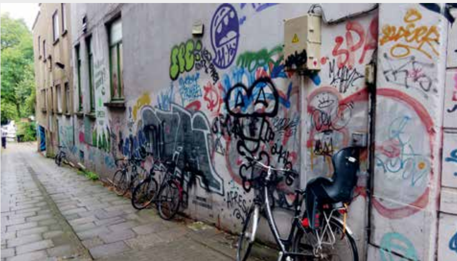
Zoutstraat, Gent

Het Mexicaan muralisme was een inspiratiebron voor het Federal Art Project dat onderdeel was van het Works Progress Administration-programma dat president Franklin D. Roosevelt in de jaren dertig introduceerde. Tussen 1935 en 1943 werden ongeveer tienduizend kunstenaars ingeschakeld om muurschilderingen en