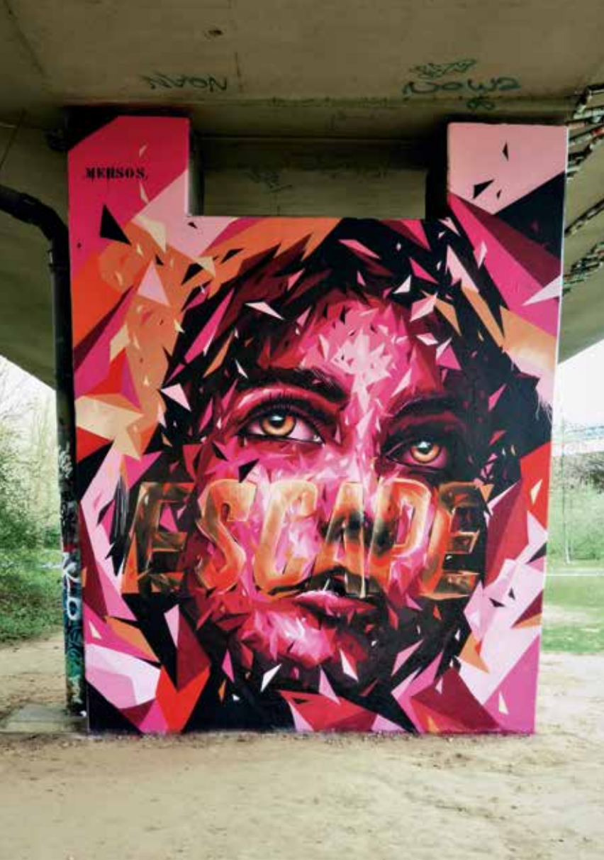
Mehsos, 2017, Brussel, Park Neerpede