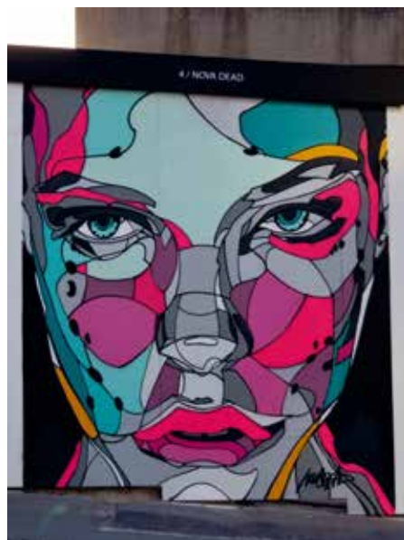
Locatelli, 2016, Brussel, Park Neerpede, initiatief van Urbana