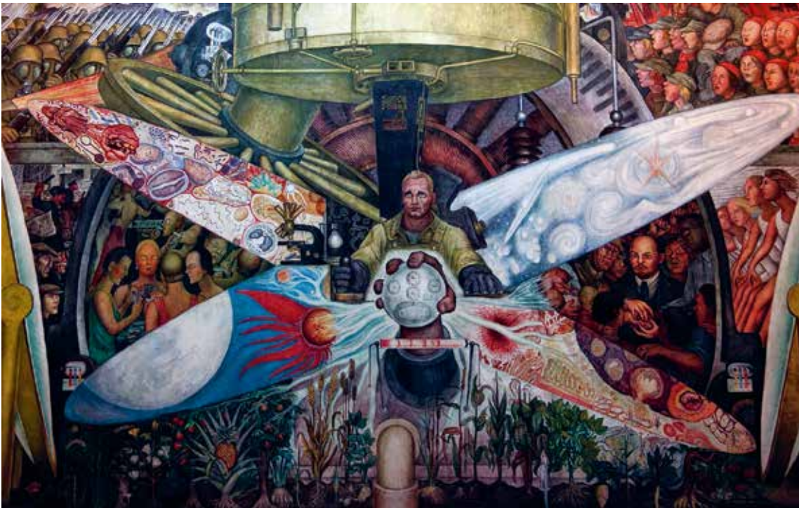
Mexicaans muralisme: Diego Rivera, El hombre controlador del universo , 1934

POPART Een andere stroming die zeer relevant is gebleken voor street art is 'pop-art'. De vroegste sporen van deze kunststroming en rebellie tegen de elite-kunstsystemen werden rond 1950 voornamelijk zichtbaar in Amerika en Engeland. Massamedia, advertenties en private bedrijven begonnen de openbare ruimte in te nemen. Dit zette een generatie van kunstenaars aan om de technieken van deze entiteiten over te nemen en te gebruiken om hun eigen creatieve werk te promoten. Andy Warhol met zijn print Campbell's Soup Cans is daar een perfect voorbeeld van. Door dagelijkse voorwerpen en elementen van populaire cultuur in