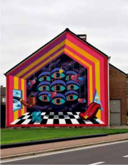
The Art of Chase, 2017, Oostende, Taboralaan, initiatief van The Crystal Ship