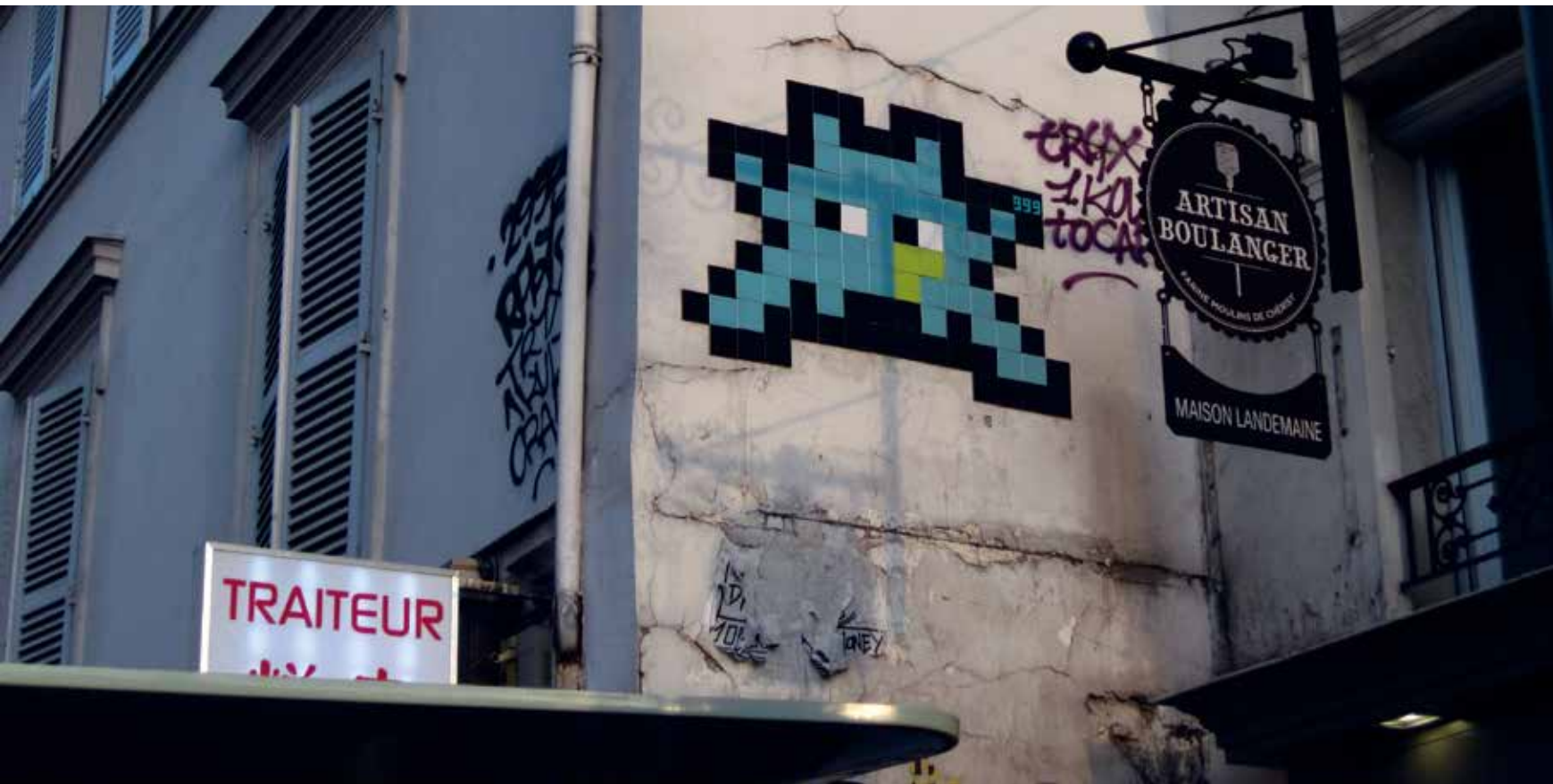
Invader in Parijs