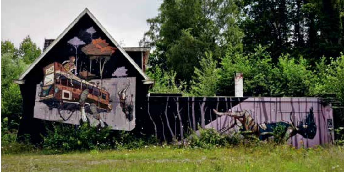
Pso Man, 2017, Hasselt, Kuringersteenweg, initiatief van Street Art Festival