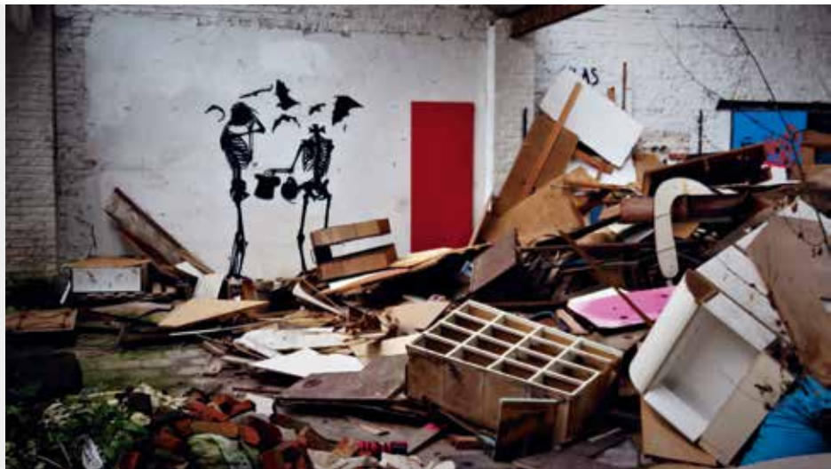
Klaas Van Der Linden, 2018, urbex in Gent

Urbex staat voor urban exploring , dit is een activiteit waarbij mensen verlaten gebouwen gaan onderzoeken. Vele street art hunters participeren aan deze activiteit omdat je vaak verrassende taferelen of verborgen kunstwerken tegen het lijf loopt. Graffiti's maar ook street art-kunstenaars trekken regelmatig naar verlaten gebouwen of oude fabrieken om werken te schilderen omdat er vaak niet voldoende legale plaatsen zijn in steden. Deze verborgen schatten worden gelukkig vaak verspreid op blogs en sociale netwerkplatformen, waardoor een groter publiek ervan kan meegenieten.