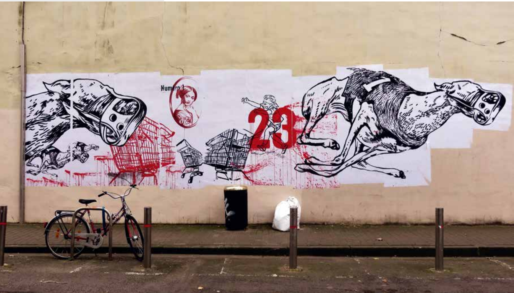
Jérôme Désert en Benoit Piret, 2017, Brussel, paste-up in Schaarbeek (verdwenen)