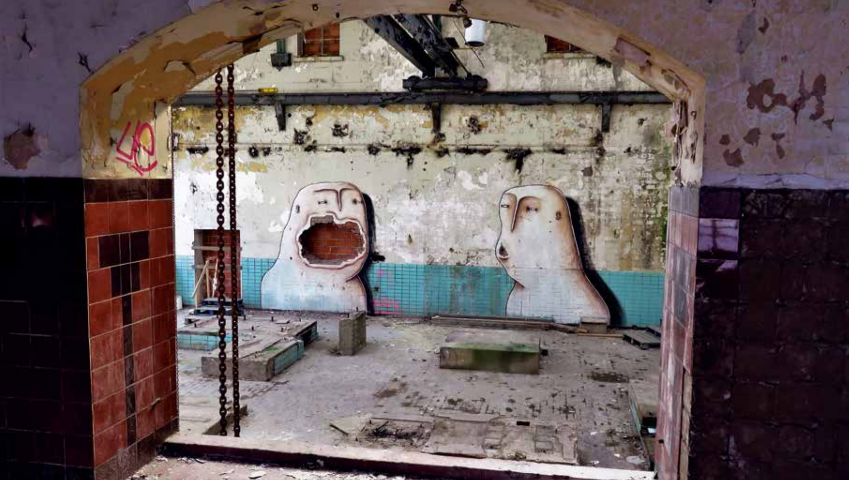
Bisser, 2017, Leuven, geheime locatie

Joachim combineert kinderlijke spontaniteit en een goede dosis punk met de werkeethiek van een mad man . Deze kunstenaar ademt kunst. Zijn werk heeft invloeden van Keith Haring en Basquiat, maar met een geheel eigen twist. Joachim schildert en tekent al zo lang hij zich kan herinneren, maar ergens in de jaren negentig ging hij zijn droom om kunstenaar te worden echt achterna. Ogen en tanden zijn elementen die zijn karakters op doek vormgaven in opvallende kleuren. Ook op straat kiest hij vaak resoluut voor een specifiek kleurpalet in combinatie met zelfzeker lijnwerk. Op relatief korte tijd lanceerde deze jonge getalenteerde kunstenaar zichzelf in de Belgische street art-scene en wist hij een eigen plek te veroveren die hem ondertussen zelfs een uiterst succesvolle solo-expositie in Londen opleverde.