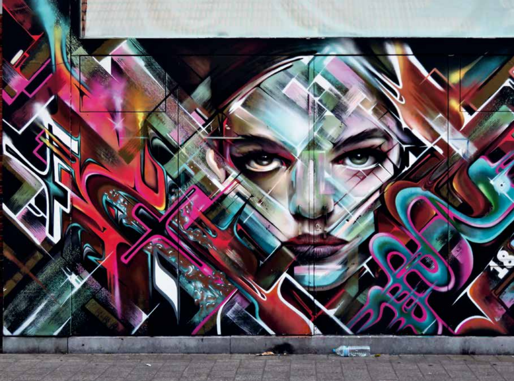
Locatelli en Rise One, Antwerpen, Sint-Erasmusstraat