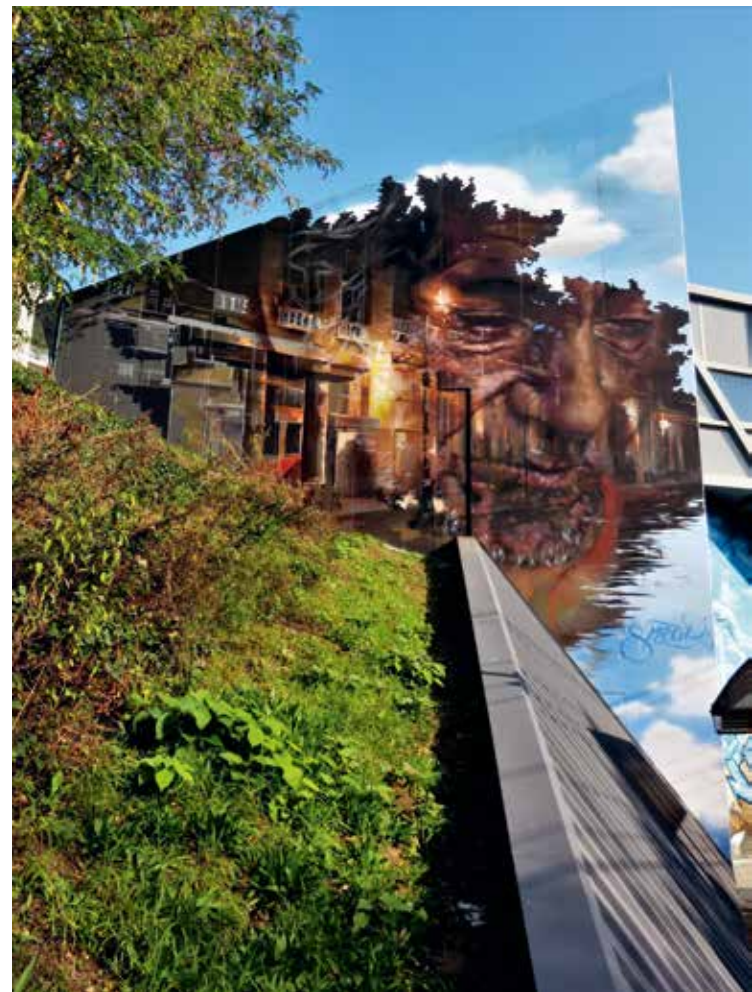
Spear, 2017, Brussel, Station Diesdelle, initiatief van NMBS