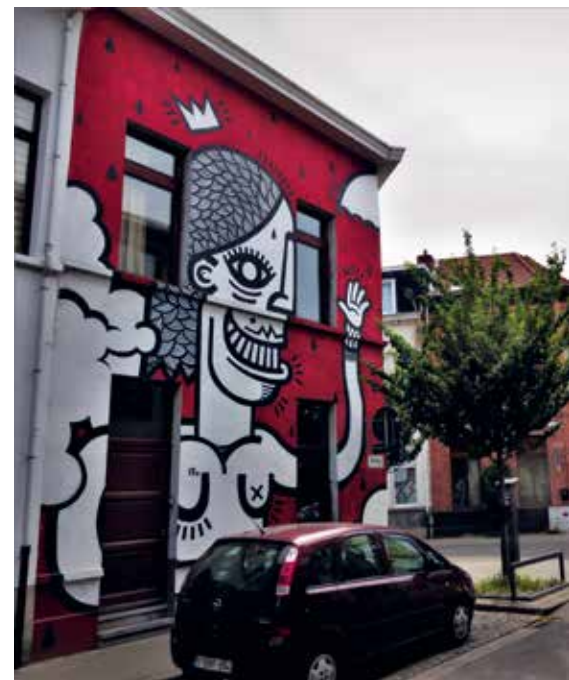
Joachim, 2016, Antwerpen, Reuzenstraat

Bisser is een jonge kunstenaar afkomstig uit Leuven die animatie studeerde in Gent. Zijn kenmerkende stijl komt voort uit een experimenteel onderzoek dat hij voerde tijdens zijn laatste jaar animatiefilm. Je kan zijn figuren in allerlei activiteiten en houdingen terugvinden, slapend in een hoekje van een park of ruziënd over de Gentse lekkernij 'neuzekes'. Zijn naam heeft hij gekozen omdat hij zijn laatste jaar als student opnieuw moest doen. Hij werkt ook op papier en doek. Zo heeft hij in 2017 een gedetailleerde tekening gemaakt van het stadhuis van Leuven waarbij hij de waterspuwers en sculpturen van heiligen verving met zijn kenmerkende figuren.