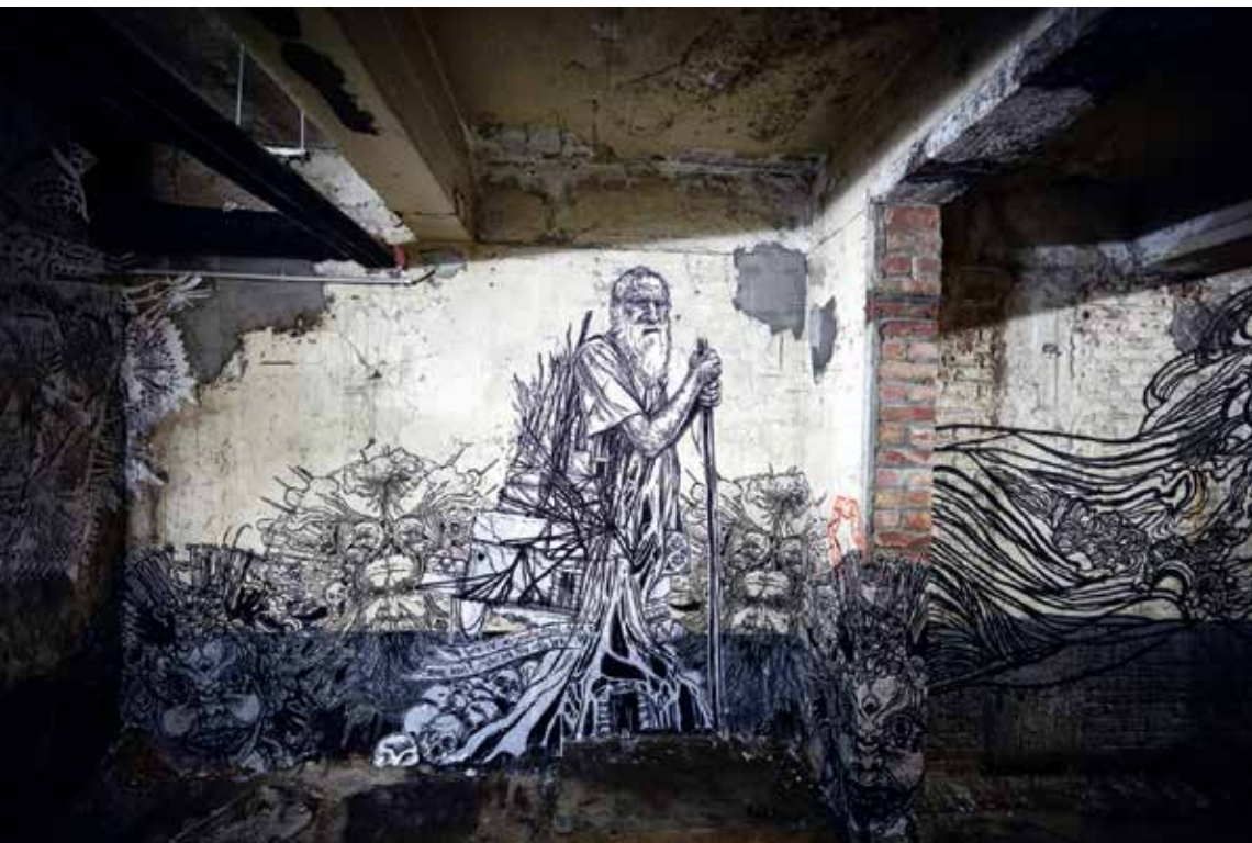
Swoon, tentoonstelling City Lights , Mima, Brussel, 2016