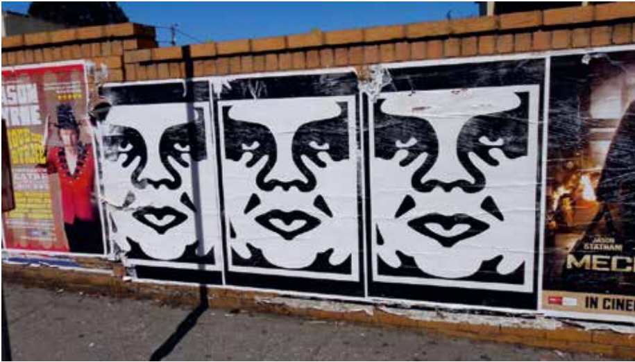
Shephard Fairey, Obey past-ups, 2011, Melbourne