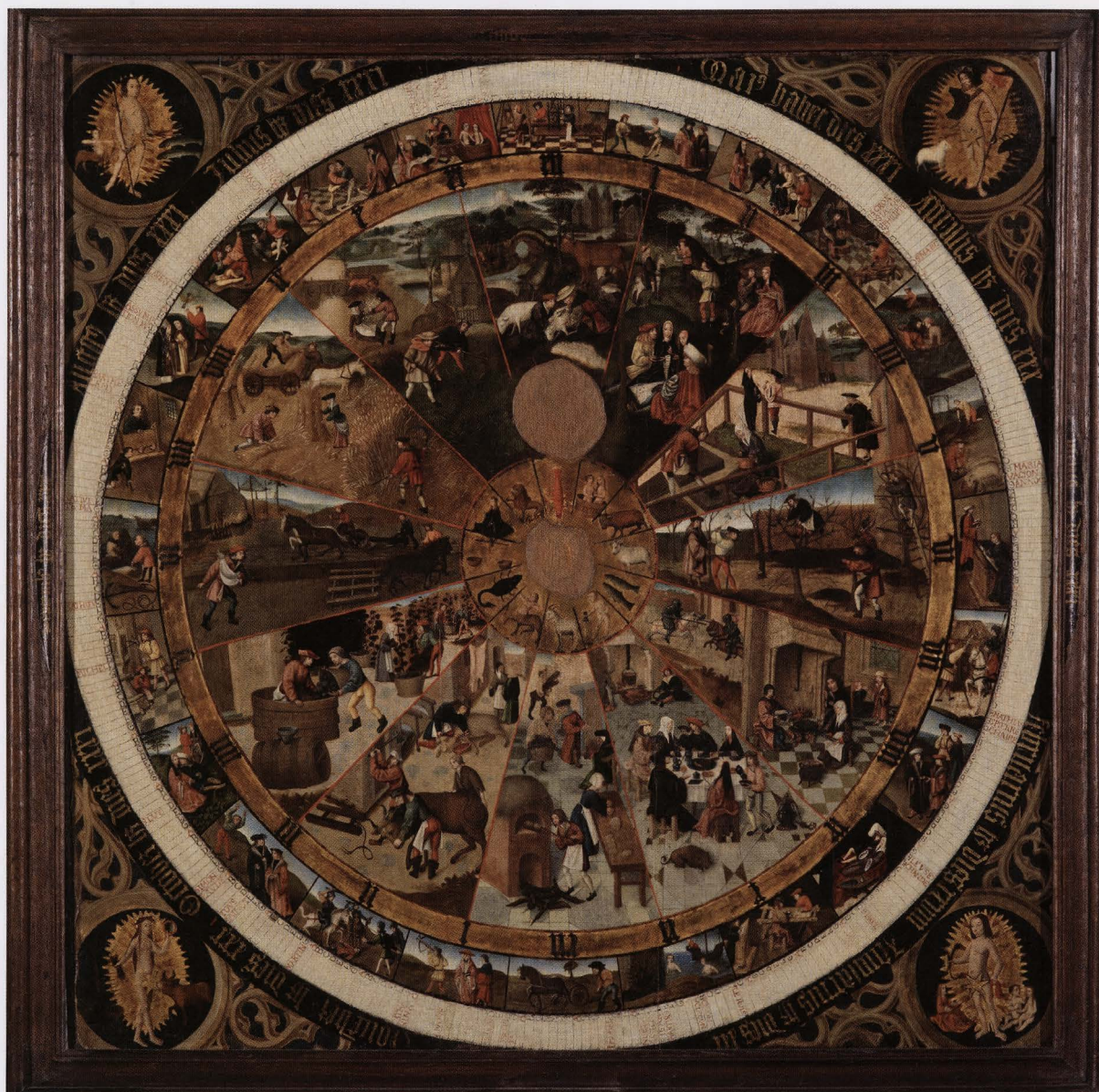
Een uniek topstuk: Brabantse uur- en kalenderwijzerplaat van een Leuvens meester omstreeks 1500

de overdracht van informatie zal veel aandacht krijgen. Hoe breng je zowel tijdelijke tentoonstellingen als een museumopstelling naar een groot en vooral breed publiek?