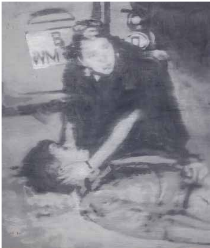
Pieter Jan Martyn, S01 Benno Ohnesorg , 2015, acryl, houtskool en olieverf op doek, 50 x 60 cm

op historische foto's die hij manipuleert of op door hem gesceneerde fotografie. Hij ondersteunt het gegeven door in tentoonstellingen soms voorwerpen die in de werken voorkomen effectief te tonen. In Duitsland had hij één van de ruimten ingericht als een (vervallen) operatiekwartier.