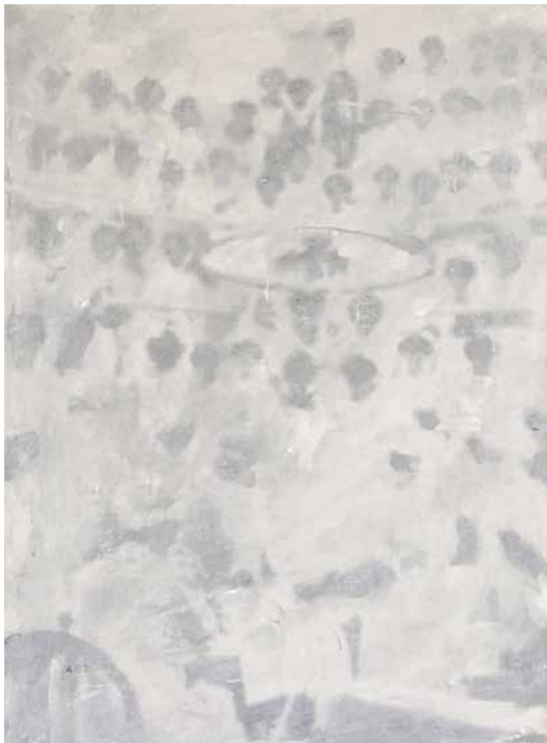
Pieter Jan Martyn, A02 the surgery , 2015, acryl en houtskool op doek, 30 x 40 cm

INFO The Resurrection of the Haze , solo, van 5 mei t.e.m. 3 juni 2018, Gallery Anouk Vilain, Bouquetstraat 123, 3590 Diepenbeek – Symbols of Democracy , solo, van 19 januari t.e.m. 17 februari 2019, Bruthaus Gallery, Molenstraat 84, 8790 Waregem – WEBSITE www.martyn.be