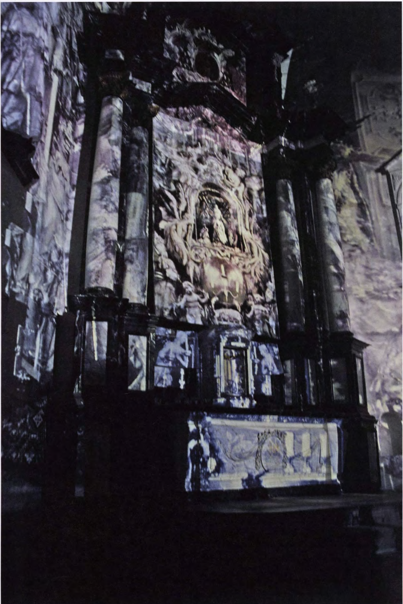
Kapel Campo Santo, Sint-Amansberg, 2005