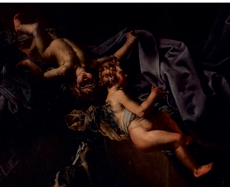
Theodoor van Loon, De geboorte van Maria, detail: de engelen die boven Anna zweven BASILIEK VAN ONZE-LIEVE-VROUW VAN SCHERPENHEUVEL

Wandelend door de zijkapellen in tegenwijzerrichting zie je het hele verhaal zich ontvouwen. In De geboorte van Maria (8 september) kijkt de pasgeboren Maria allerliefst de wereld in, op schoot bij haar bejaarde moeder (veel ouder dan zelfs de meest rijpe moeders van onze tijd). Waar vond Van Loon ze, die aandoenlijk mooie baby's in zijn schilderijen? Hij moet aandachtig rondgekeken hebben in zijn dagelijks leven, het schetsboek altijd bij zich gehad hebben om hun trekken vast te leggen. De engelen die boven Anna zweven bewijzen het nogmaals. Van Loon was een meesterlijke schilder van kinderen van alle leeftijden. En het opschrift verankert alles weer in Bijbels perspectief. De profeet Jesaja verkondigde immers: "een twijg ontspruit aan de stronk van Isai" – Virga Jesse.