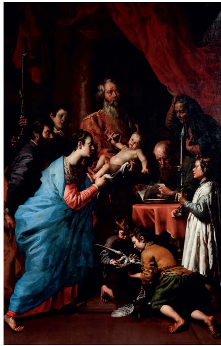
Theodor van Loon, De opdracht in de tempel BASILIEK VAN ONZE-LIEVE-VROUW VAN SCHERPENHEUVEL

van Jacobus, het bekendste apocrief geschrift over Maria, lezen we: “En hij zette haar op de derde tree van het altaar en de Heer God deed genade op haar neerdalen en zij danste op haar voetjes en het hele huis Israël kreeg haar lief.” Het opschrift verwijst, geheel passend bij dit tafereel, naar Maria als Jacobs ladder (Genesis 28).