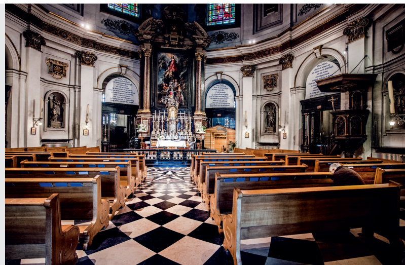
Het hoogaltaar met Tenhemelopneming van Maria (1623) door Theodoor van Loon