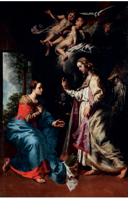
Theodor van Loon, De verkondiging BASILIEK VAN ONZE-LIEVE-VROUW VAN SCHERPENHEUVEL