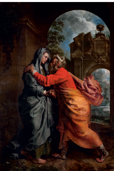
Theodoor van Loon, De ontmoeting van Joachim en Anna bij de Gouden Poort, 1616 BASILIEK VAN ONZE-LIEVE-VROUW VAN SCHERPENHEUVEL