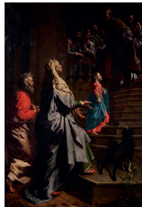
Theodoor van Loon, De presentatie van Maria in de tempel BASILIEK VAN ONZE-LIEVE-VROUW VAN SCHERPENHEUVEL