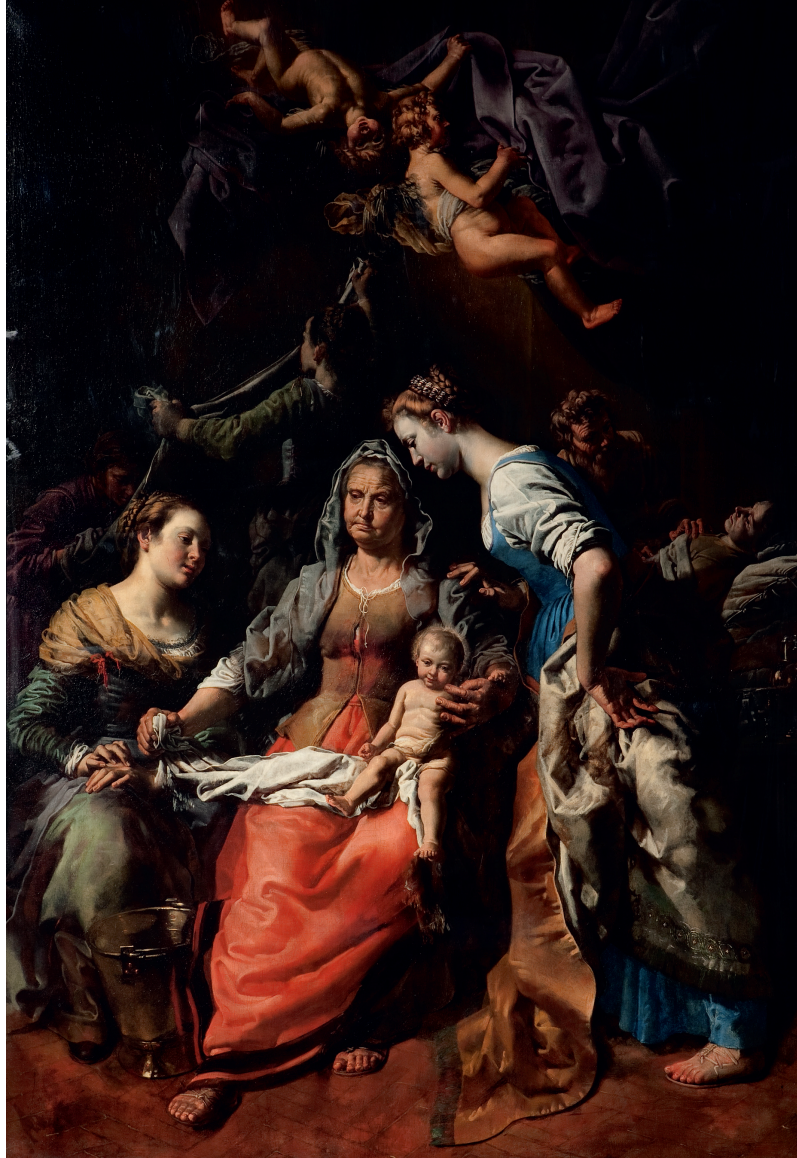
Theodoor van Loon, De geboorte van Maria BASILIEK VAN ONZE-LIEVE-VROUW VAN SCHERPENHEUVEL