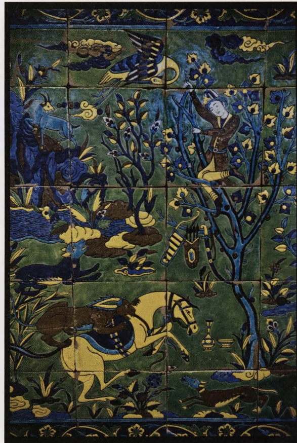
Geheel van 20 muurtegels met jachtafereel, Isfahan (Iran), 17de eeuw, geglazuurde ceramiek