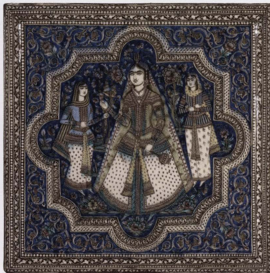
Tegel, vermoedelijk Ali Muhammad Isfahani, Teheran, jaren 1880 of 1890, beige aarde, beschilderd onder transparant glazuur