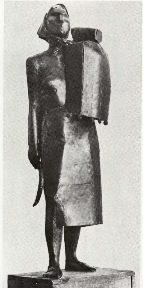
daaronder: Michaël Schœnholtz Kleine Mannequin 1971, marmer.