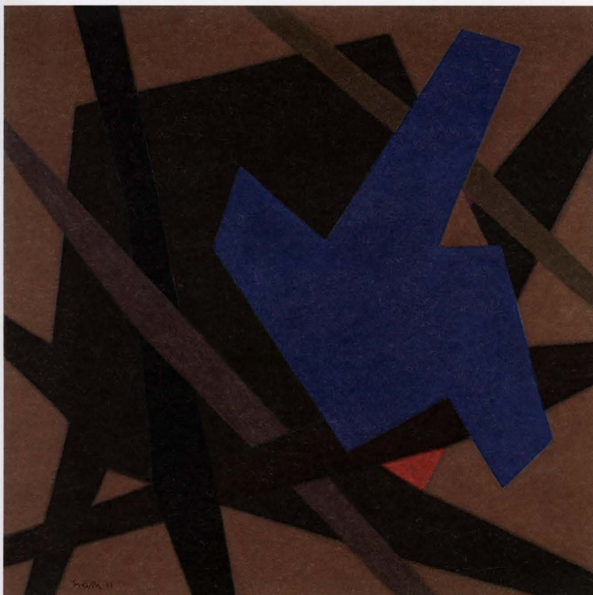
Roger Greisch, Sérénité, 1987, olieverf op doek, 150 x 150 cm