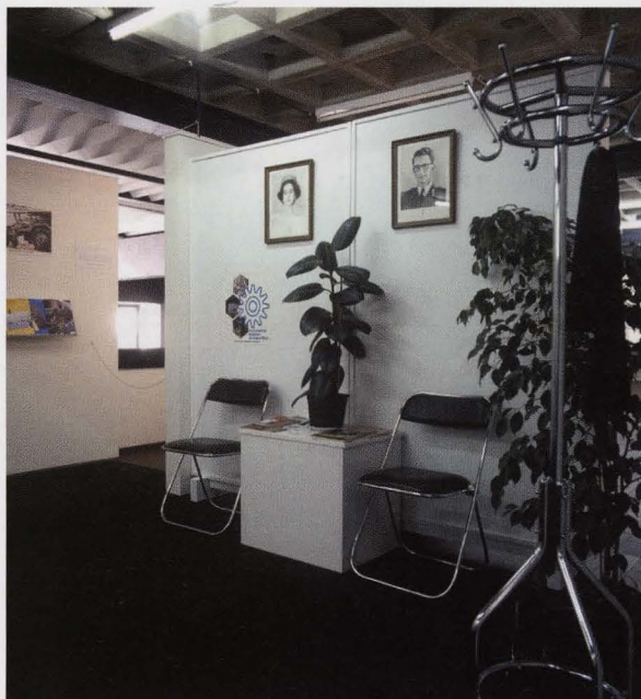
Informatiestand Leger, 1987 UNIVERSITEIT GENT

Van 5 april tot 31 augustus 2008 Open: dinsdag tot en met zondag van 10 tot 18 uur Gesloten: maandag { S.M.A.K. { Citadelpark 9000 Gent Tel. 09 240 76 64 www.smak.be