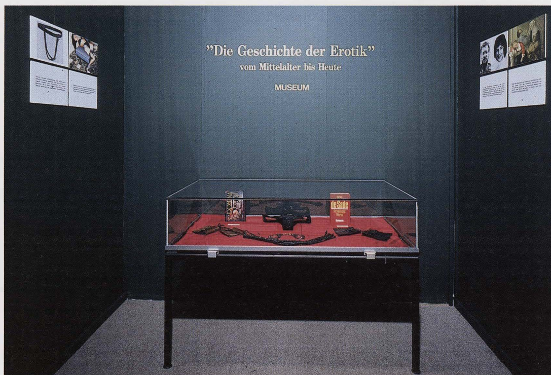
Die Geschichte der Erotik vom Mittelalter bis Heute. Museum, Small Stuff I HERMAN TEIRLINCX-HUIS, BEERSEL