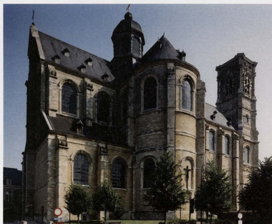
Algemeen zicht (zuidwest) op de Abdijkerk Sint-Servaas, Grimbergen

hemels schouwspel: de triomf van de Heilige Norbertus. Volgens alle regels van het genre zorgt de valse architectuur ervoor dat wij het bestaan van een plafond vergeten. Waar eindigt het gebouw, waar begint de illusie? Binnen het trompe-l'oeil wordt het spel nog verder doorgedreven. De wanden lijken door te lopen in een