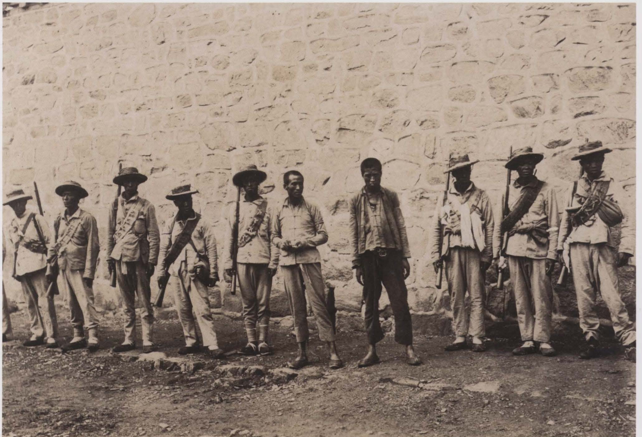
De 'brigands' werden gevangen genomen door Chinese soldaten, ze poseren samen. Twee dagen later worden de gevangenen gefusilleerd ARCHIEF PATERS SCHEUTISTEN