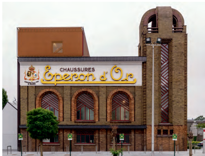
De gerestaureerde schoenfabriek met in de gevelries het opschrift Eperon d'Or en de wapenschilden van België en Luxemburg in ververst bladgoud © EPERON D'OR