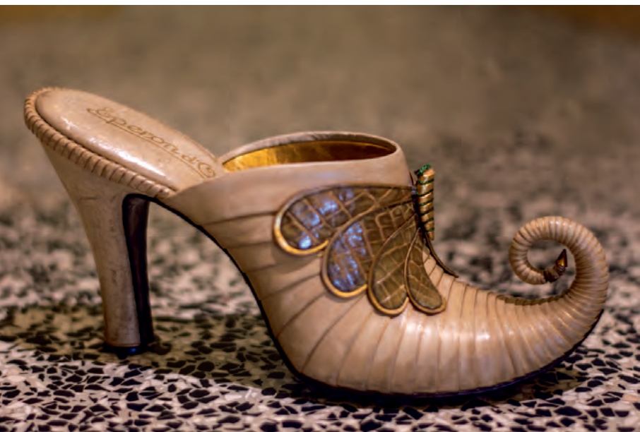
Damesschoen van Izegemse makelij, 1920-1930