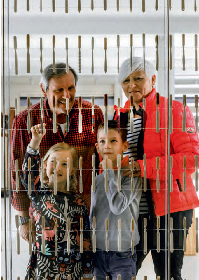
Collectie tandenborstels in been en varkenshaar, Noord-Frankrijk, 1900-1925