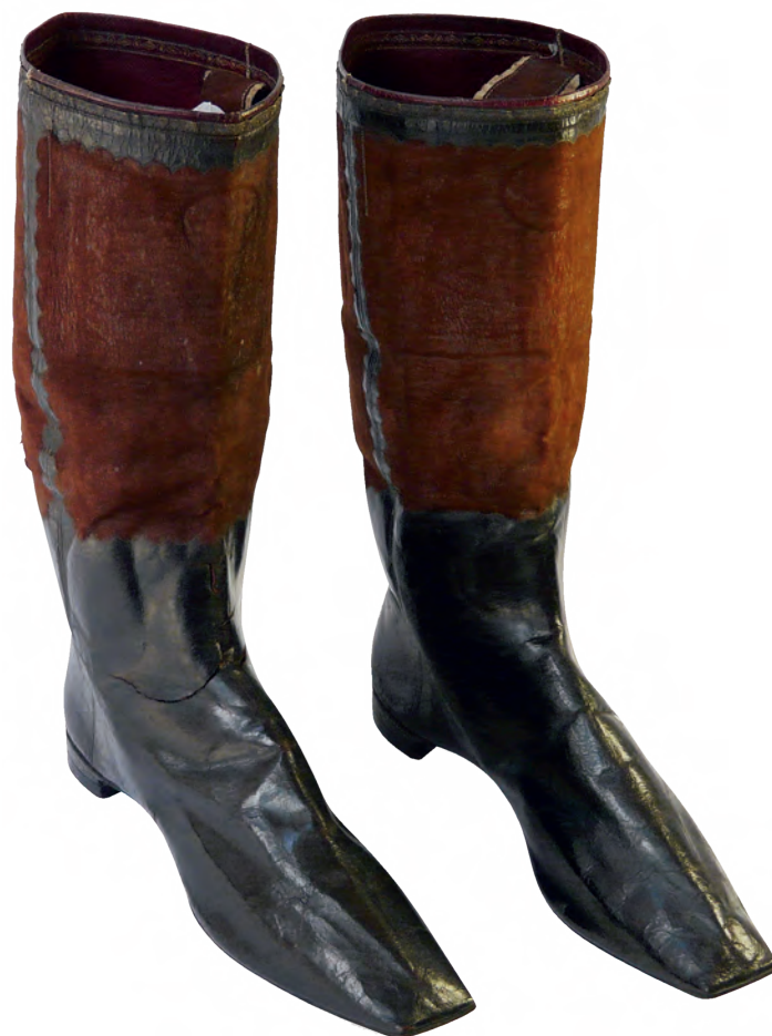
De laarzen van Willem I van de hand van Eduard Dierick, 1828

Hilde Colpaert: "Het museum heeft zelf ook de opdracht innovatieve en duurzame technieken of grondstoffen in de schoen- en borstelnijverheid op te sporen en door te geven. Dat resulteerde onder meer in een workshop bacterieel leder of paddenstoelenleder waarbij je je eigen materiaal kan laten groeien met plantaardige ingrediënten (in het kader van het Maak het mee -project van Resoc en Erfgoedcel BIE). De workshop werd gegeven door Magma Nova Gent dat werkt rond biofabricage. Het schoenmuseum werd destijds in 1968