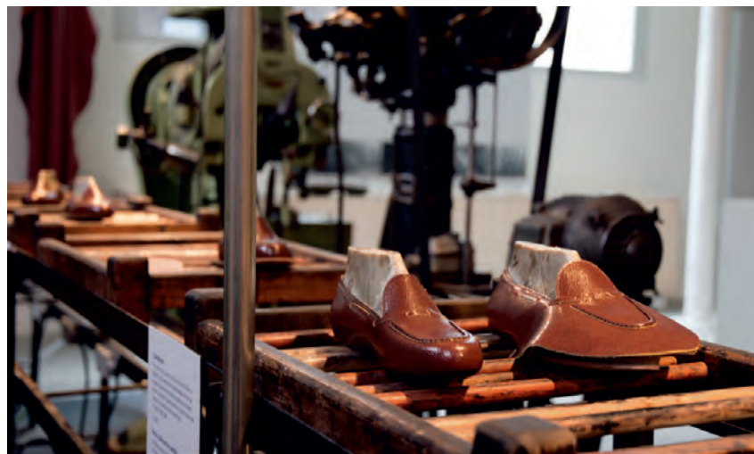
Zicht op het machinepark in de fabriekshal van Eperon d'Or

Op het dak is discreet een 'gouden schoendoos' geplaatst die dienst doet als streekbezoekerscentrum. Je kan er de Leiestreek verkennen met een interactieve kaart (i.s.m. Westtoer) en door viewmasters naar het Izegemse fabrieksverleden loeren. Vergeet niet ook eens naar buiten te kijken naar de lange rij zaagtanddaken.