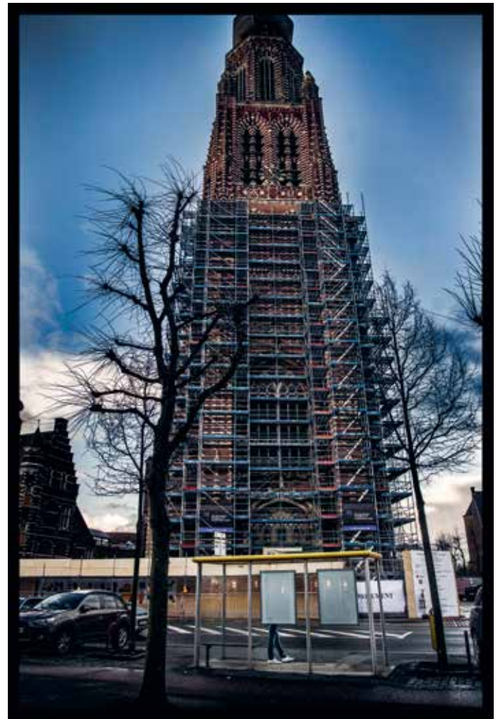
De Sint-Katharinakerk in Hoogstraten, omgord met steigers en steunen