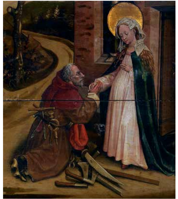
Het leven van Sint-Jozef, detail: Jozef keert terug naar Maria en vraagt knielend vergiffenis voor zijn twijfel en impliciete beschuldiging