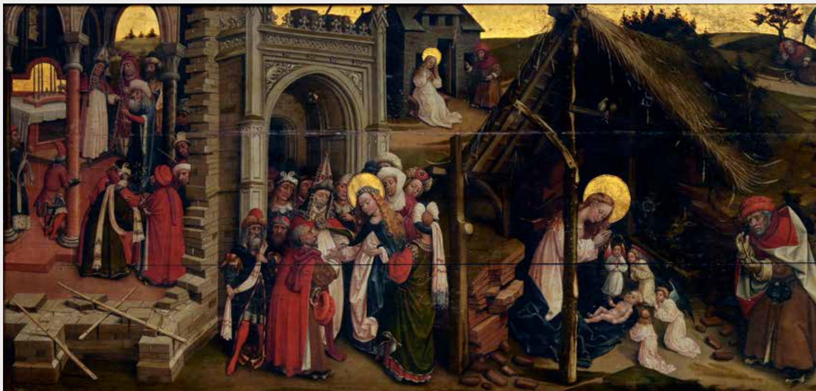
Anoniem, Het leven van Sint-Jozef , tweede helft 15de eeuw, olieverf op paneel, 204 x 64 cm