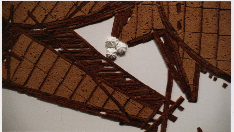
Stardust, 2006, 940 x 390 cm, peperkoek, meringue en biscuit