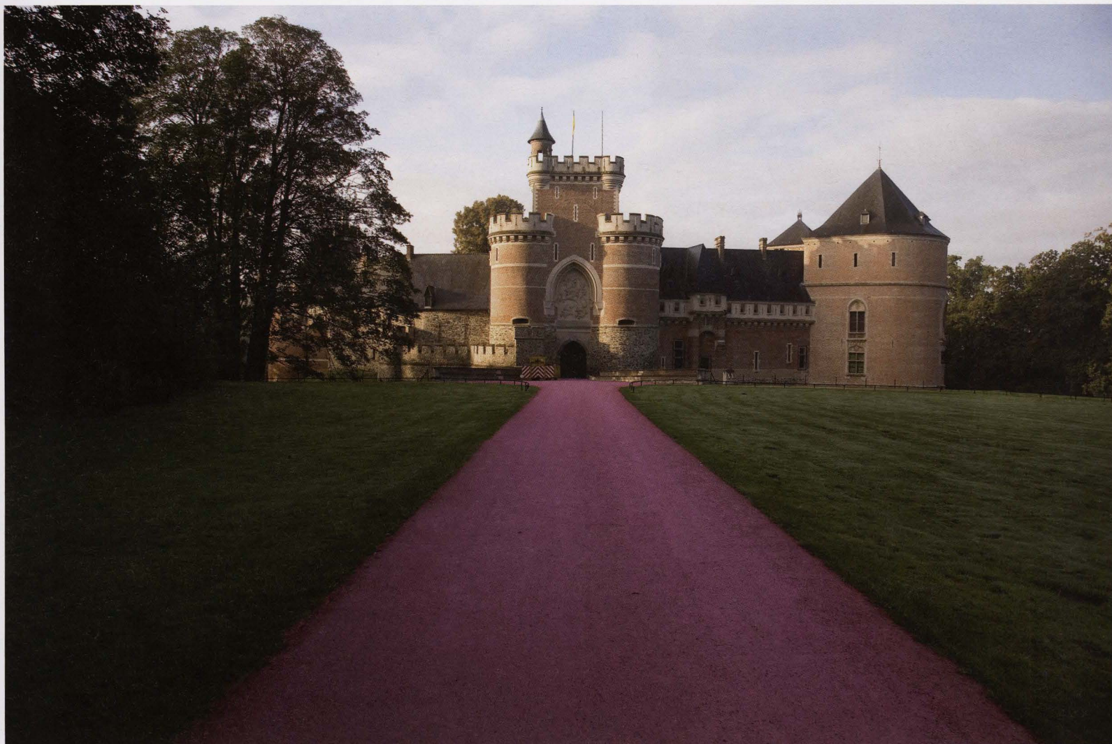
The Weight of Wonder , 2008, 100 x 4 m, <15 ton roze kiezelstenen

weg te werken, zette ze die net in de verf door gekleurd pigment in het plamuursel toe te voegen. Nadien bracht ze pin ups, palmbomen en andere herkenbare figuren uit de populaire cultuur op de muur aan met boorgaten.