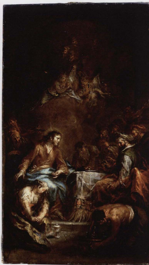
Martin Johann Schmidt (bijgenaamd Kremser Schmidt), Links: Annunciatie, olieverf op doek, 36,5 x 22,5 cm Rechts: De maaltijd in het huis van de farizeeër Simon, olie-verf op doek, 63,3 x 36,5 cm