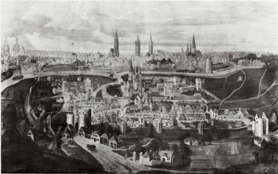
Lucas de Heere (kopie naar), Gezicht op de heerlijkheid van St.-Baafs met op de achtergrond een kijk op de stad Gent, Kapittelzaal St.-Baafskathedraal, Gent