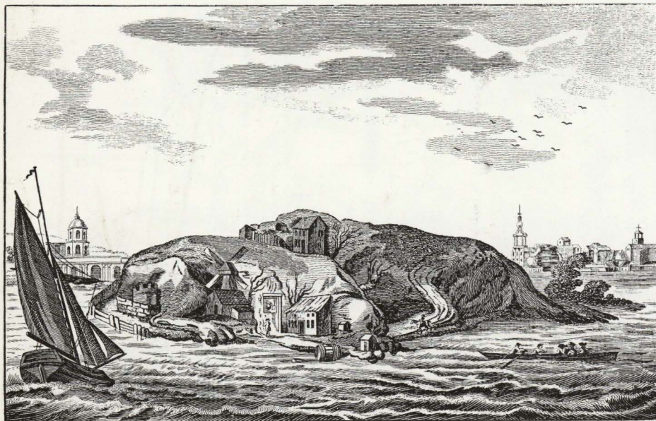
18de-eeuwse volksprent: Het hondeneiland

Conservator Museum Boymans-van Beuningen, Rotterdam