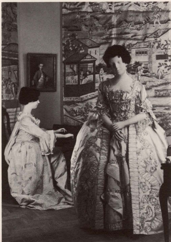
Twee japonnen van witte zijde, ca. 1755

In de 17de eeuw had de handel Holland en zijn burgers rijk gemaakt. Veel van de 18de eeuwse nakomelingen van de 17de eeuwse zakenlui vonden het niet nodig die rijkdommen verder te vergroten. Zij stelden zich tevreden met het uitoefenen, of eigenlijk meer met het hebben, van functies in het stedelijk bestuursapparaat. Doordat de groep van bevoorrechten steeds klein gehouden werd en de meesten niet meer deelnamen aan het economisch proces, ontstond er een soort bestuurlijke kaste, die door een grote kloof van het gewone volk gescheiden was. Ze bekleedden allerlei bestuursfuncties van sociale instellingen en werden graag in die functies geportretteerd. De 18de-eeuwer liet zich — veel meer dan dat in de 17de eeuw gebeurde — in zijn eigen huiselijke omgeving schilderen. In vergelijking met de kunst-elders-in-Europa hadden de Hollandse kunstenaars altijd al een voorkeur voor het intieme, voor onderwerpen, betrokken op het dagelijks leven; dat intieme werd in de 18de eeuw knus. Fraaie Heren. De herenkleding zag er, de hele eeuw door, ongeveer hetzelfde uit. De heren waren dol op geraffineerde kleuren, meestal zachte pasteltinten, op kanten jabots en manchetten, op een sierlijk geborduurd figuurtje op zijden kousen, gouden en zilveren gespen op de schoenen, fijn bewerkte horloges en wan-