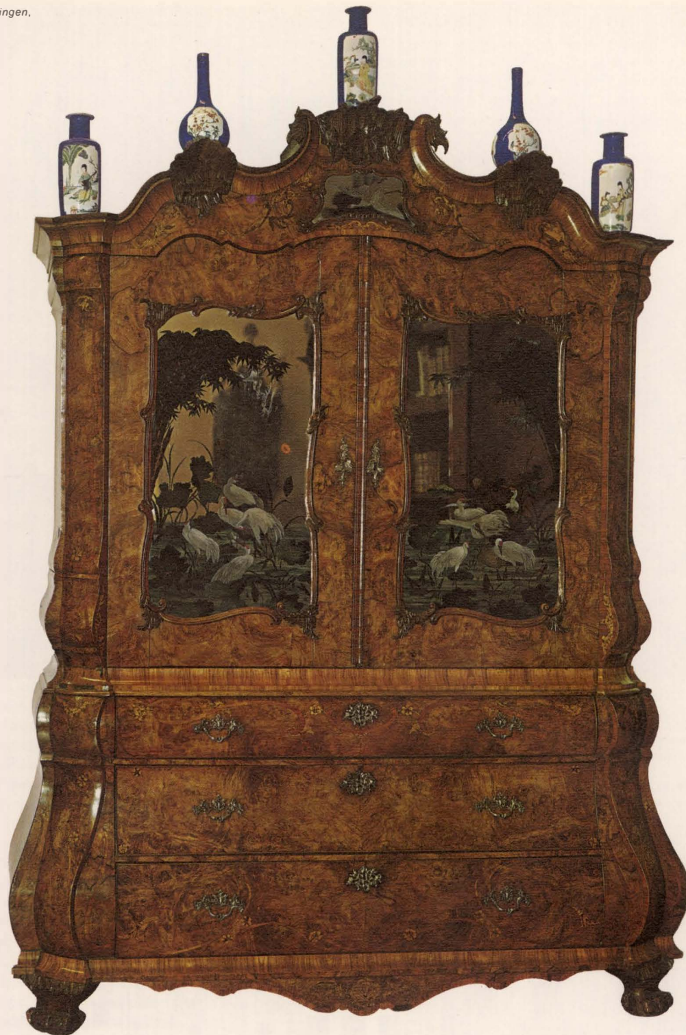
Spiegelkabinet met imitatie Chinese schilderijen, ca. 1750

eerst gebruikt in 1275 in een tolbrief van Floris V. De stad is gebouwd langs de rivier de Amstel. De vroegste stadsuitbreidingen vonden langs het water plaats. Eerst had de stad vòòr-burgwallen, toen, daar achter, achter-burgwallen. En om die langwerpige kern heen, nog steeds duidelijk op de kaart te zien, werden tot 1610 voortdurend nieuwe stukjes aangebouwd. In 1612 nam het Stadsbestuur het besluit tot de 'grote vergroting': het uitbreiden van de stad met de drie grachten, Heren-