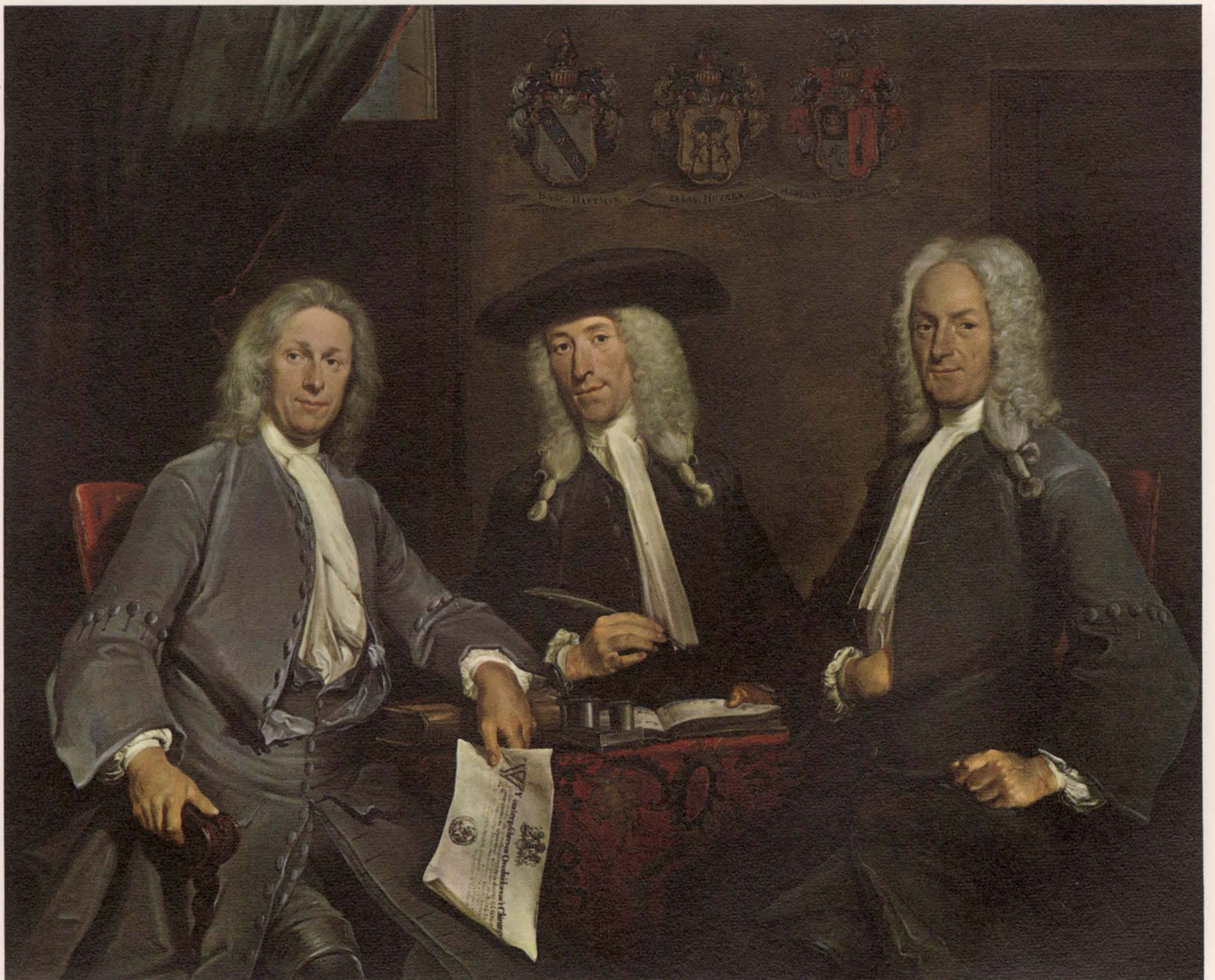
Cornelis Troost (1697-1750), Drie overlieden van het Chirurgijngilde te Amsterdam, 1731

Hollandse kunst en kunstnijverheid in de achttiende eeuw