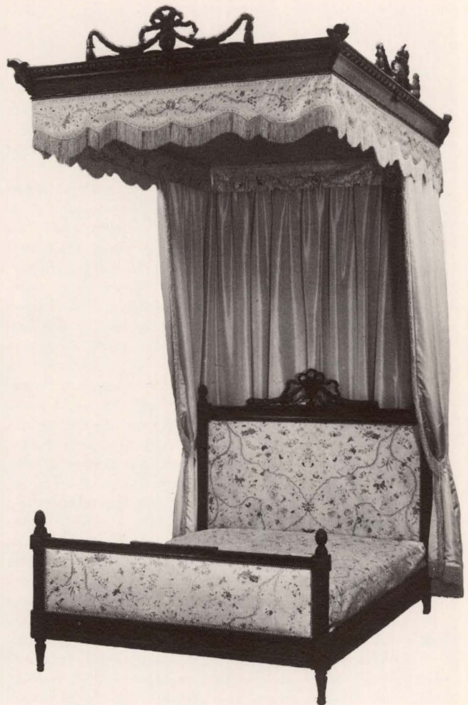
Ledikant bekleed met Chinese zijde, ca. 1780

Goed wonen. De slaapkamers verhuisden van de donkere sou- terrains naar lichtere bovenverdiepingen. De bedden werden open en licht van constructie. Dat waren de stoelen ook. Niet meer de logge vierkante vormen van de 17de eeuwse stoelen, nu buigen de stoelpoten sierlijk naar voren, zittingen en rugleu- ningen hebben gewelfde omtrekken. In de eerste helft van de eeuw waren de stoelen geïnspireerd op Engelse modellen: hoge onbeklede rugleuningen met een versierd middenpaneel en on- versierde naar voren gebogen voorpoten. De versieringen zullen leunen wel onmogelijk hebben gemaakt. Maar dat zal best de bedoeling zijn geweest, want men prees iemands fiere, recht- oppe houding. Dat ging ook nog op, toen de stoelen bekleed werden met trijp, of met velours. Want na 1750 was niet langer de Engelse, maar de Franse meubelstijl toonaangevend.