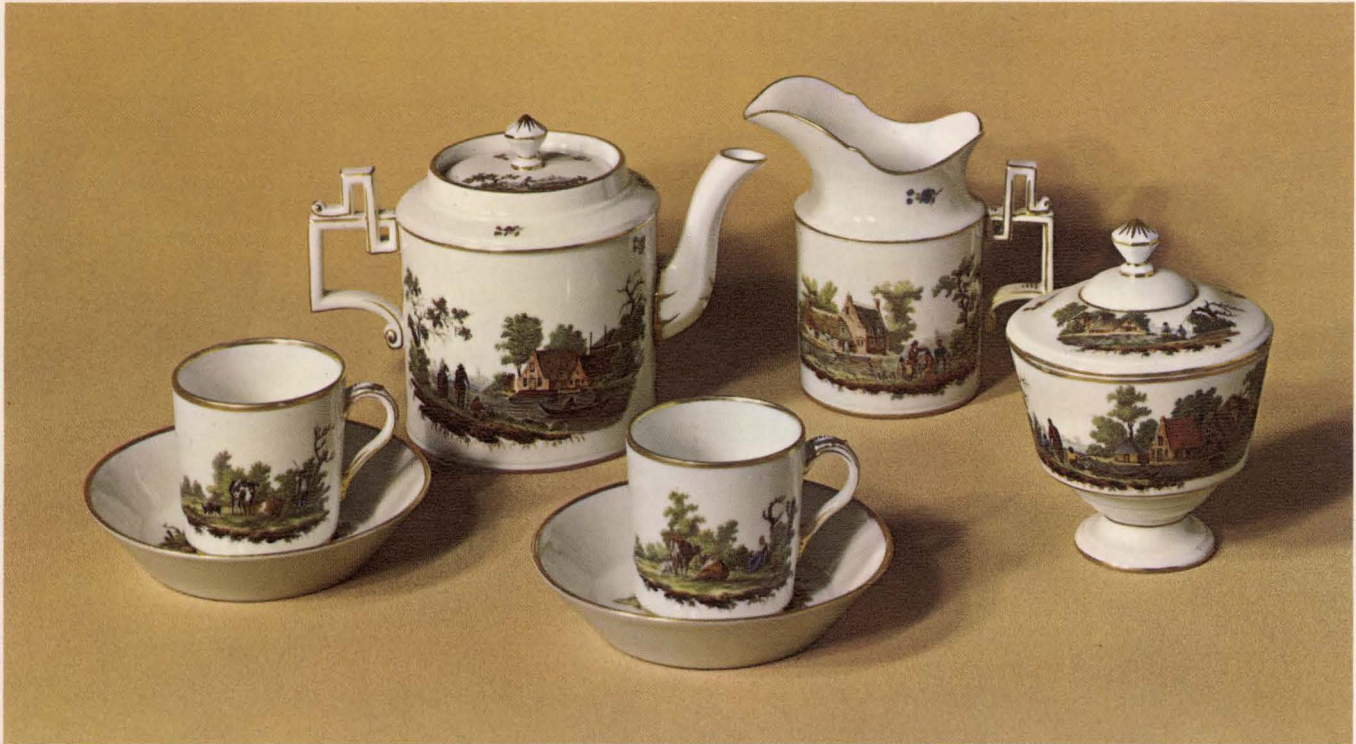
Koffieservies van porselein, Ouder-Amstel, ca. 1800

Veel van de ons nu bekende meubelen zijn 18de eeuwse 'uitvindingen': het kabinet, een kast met twee deuren en enkele laden daaronder, die bestemd was voor porselein of linnengoed; schrijfmeubels: secretaïres en schrijfbureaus, want het brieven-schrijven werd de grote mode.