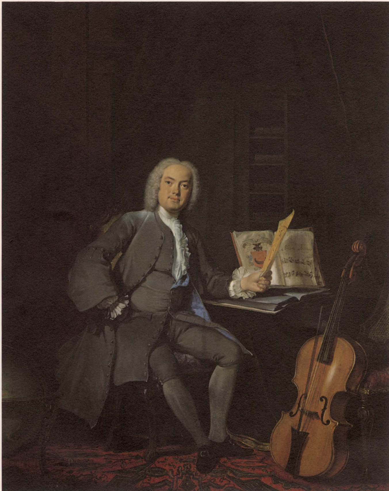
Cornelis Troost, De muziekiefhebber , 1736