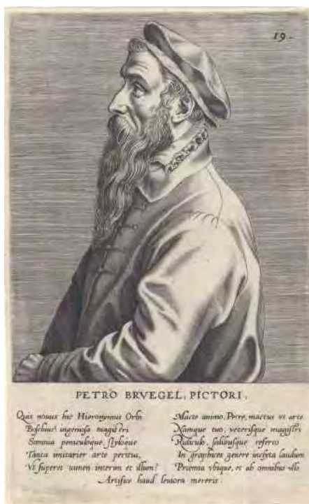
Johannes Wierix (toegeschreven aan), Portret van Pieter Bruegel de Oude , 1572, gravure, 203 x 124 mm