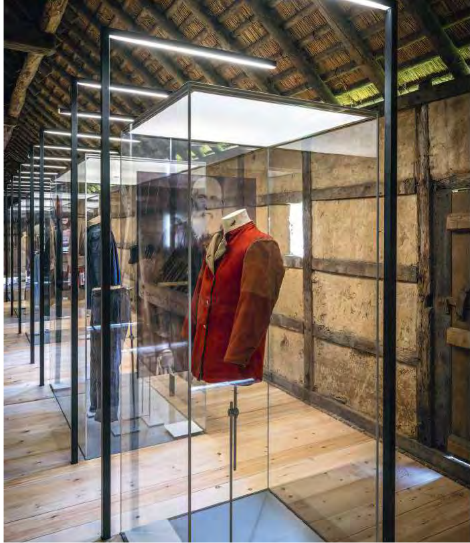
BKRK Textiel op het Erf Tessenderlo

vanuit het heden naar gisteren en morgen in onze superdiverse maatschappij is een van Bokrijks belangrijkste ambities.