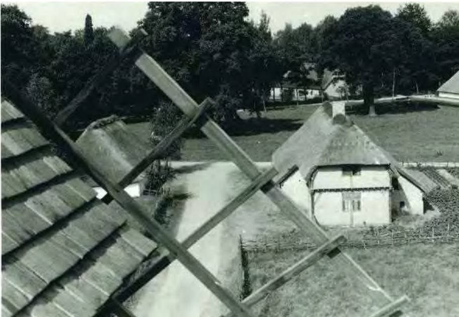
Zicht op de ‘Bruegelhoeve’ in het Openluchtmuseum Bokrijk (1967)