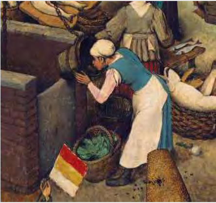
Pieter Bruegel de Oude, De strijd tussen Carnaval en Vasten , detail