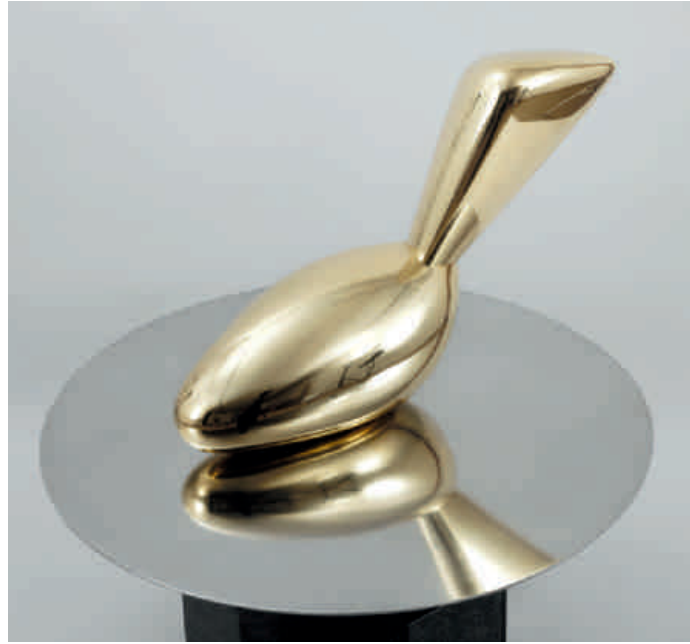
Constantin Brancusi, Leda , 1926

© CENTRE POMPIDOU, MNAM-CCI, DIST.RMN-GRAND PALAIS - ADAM RZEPKA, SABAM BELGIUM, 2019