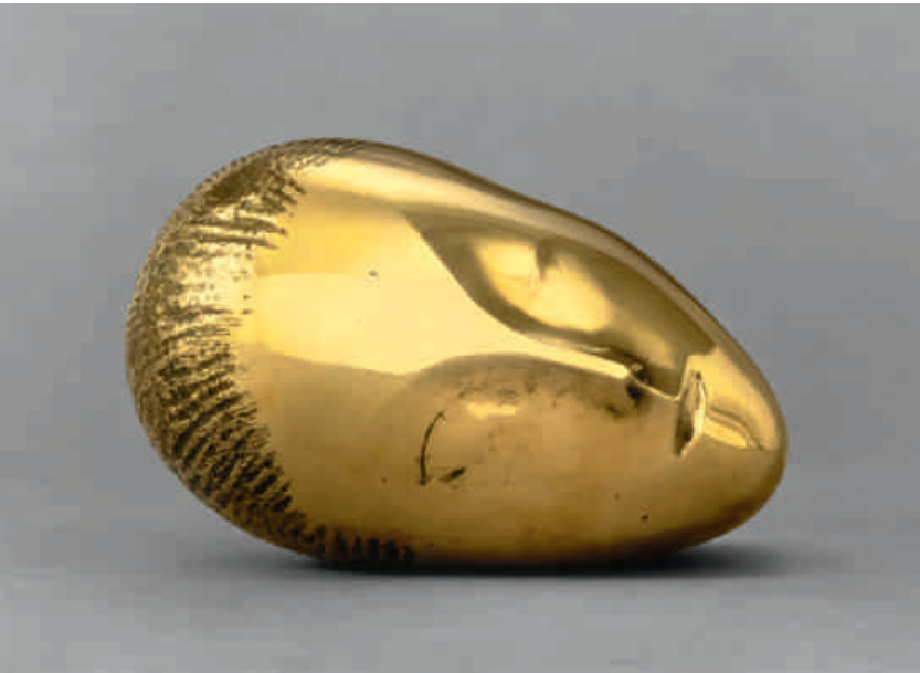
Constantin Brancusi, Muse endormie , 1910