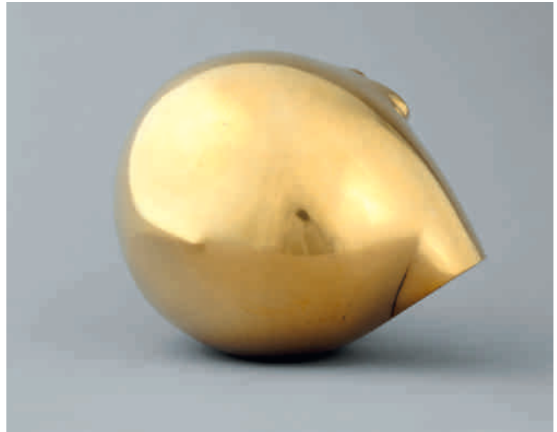
Constantin Brancusi, Prometheus, 1911

RODIN Na omzwervingen via Boekarest en München belandt Brancusi in Parijs. Daar krijgt zijn artistieke droom zijn beste invulling: in de nabijheid van Auguste Rodin. Van januari tot april 1907 werkt hij in diens atelier. Rodin is de enige beeldhouwer die tot de essentie doordringt, die de kern der dingen wil uitdrukken. Brancusi streeft hetzelfde doel na, vandaar dat hij Rodins aanbod om zijn assistent te worden niet aanneemt. “Er kan niets groeien in de schaduw van een grote boom,” luidt Brancusi’s nuchtere vaststelling; meteen een dubbel statement: een hulde aan de reële grootheid van Rodin en het vaste geloof in zijn eigen kunnen.