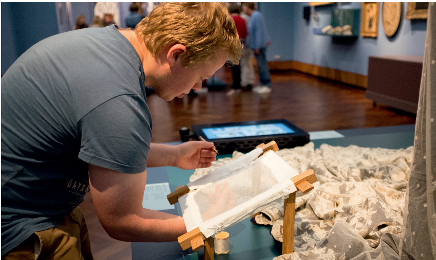
De typische Lierse steekkant is geen kloskant: bezoekers kunnen proberen om met een haaknaald op tule te borduren

Op toeristische affiches wordt al dat schoons vanaf de jaren vijftig gretig het ‘Brugge der Kempen’ genoemd. Tijdens de wederopbouw na de Eerste Wereldoorlog koos Lier voor historische neostijlen waardoor de stad er ouder en pittores-