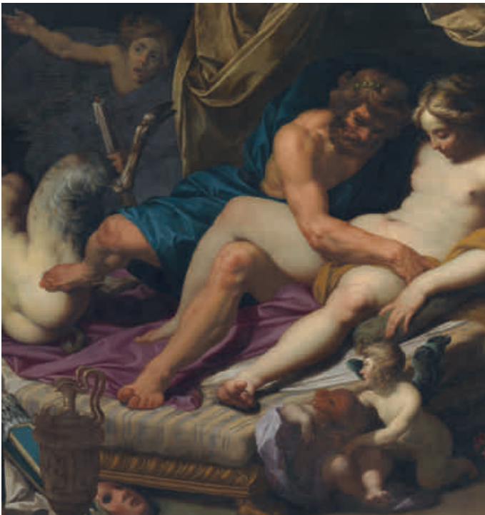
Abraham Janssen, Hercules verduist Faunus uit het bed van Omphale , 1607 STATENS MUSEUM FOR KUNST, KOPENHAGEN

vrije markt. Dit waren doorgaans werken van bescheiden afmetingen, vaak met een sexy mythologisch onderwerp, maar ook afbeeldingen van de Madonna zullen het publiek hebben aangesproken. Deze Madonna is qua stijl trouwens nauw verwant met Janssens bekendste vroege mythologische tafereel, Hercules verdriest Faunus uit het bed van Omphale (1607, Kopenhagen, Statens Museum for Kunst). Het gelaat van Maria lijkt sprekend op dat van koningin Omphale en de zwerige blonde lokken van Jezus lijken op die van de knaapjes in het Kopenhagense schilderij. Het is niet onbelangrijk, want op basis van die overeenkomsten kon dit schilderij in 2018 overtuigend worden toegeschreven aan Janssen, terwijl het voordien beschouwd werd als een verdwaald werk van de Franse maniërist Martin Fréminet.