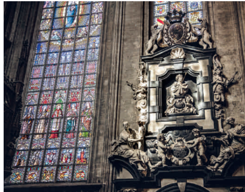
Monument van de familie de la Tour et Tassis in de Zavelkerk

INFO Onze-Lieve-Vrouw-ter-Zegekerk – Zavel, Brussel – Open: maandag t.e.m. zaterdag van 10.00 tot 17.30 uur, zondag van 10 tot 11 uur en van 13.30 tot 17.30 uur – www.vlaamsemeestersinsitu.be