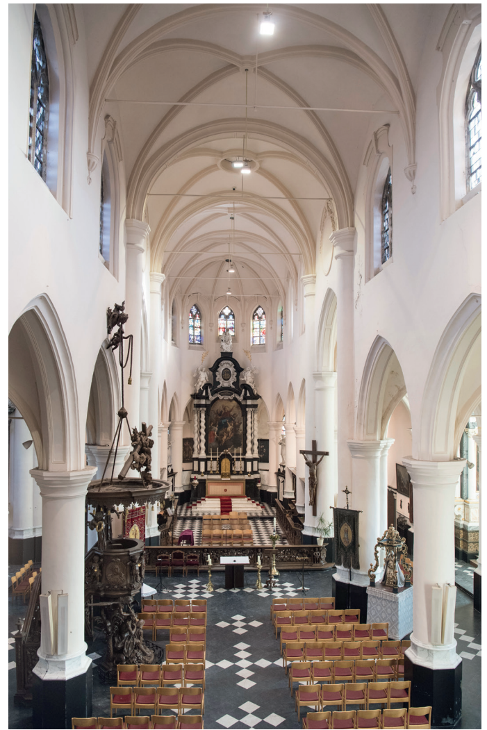
'De kathedraal van het noorden'