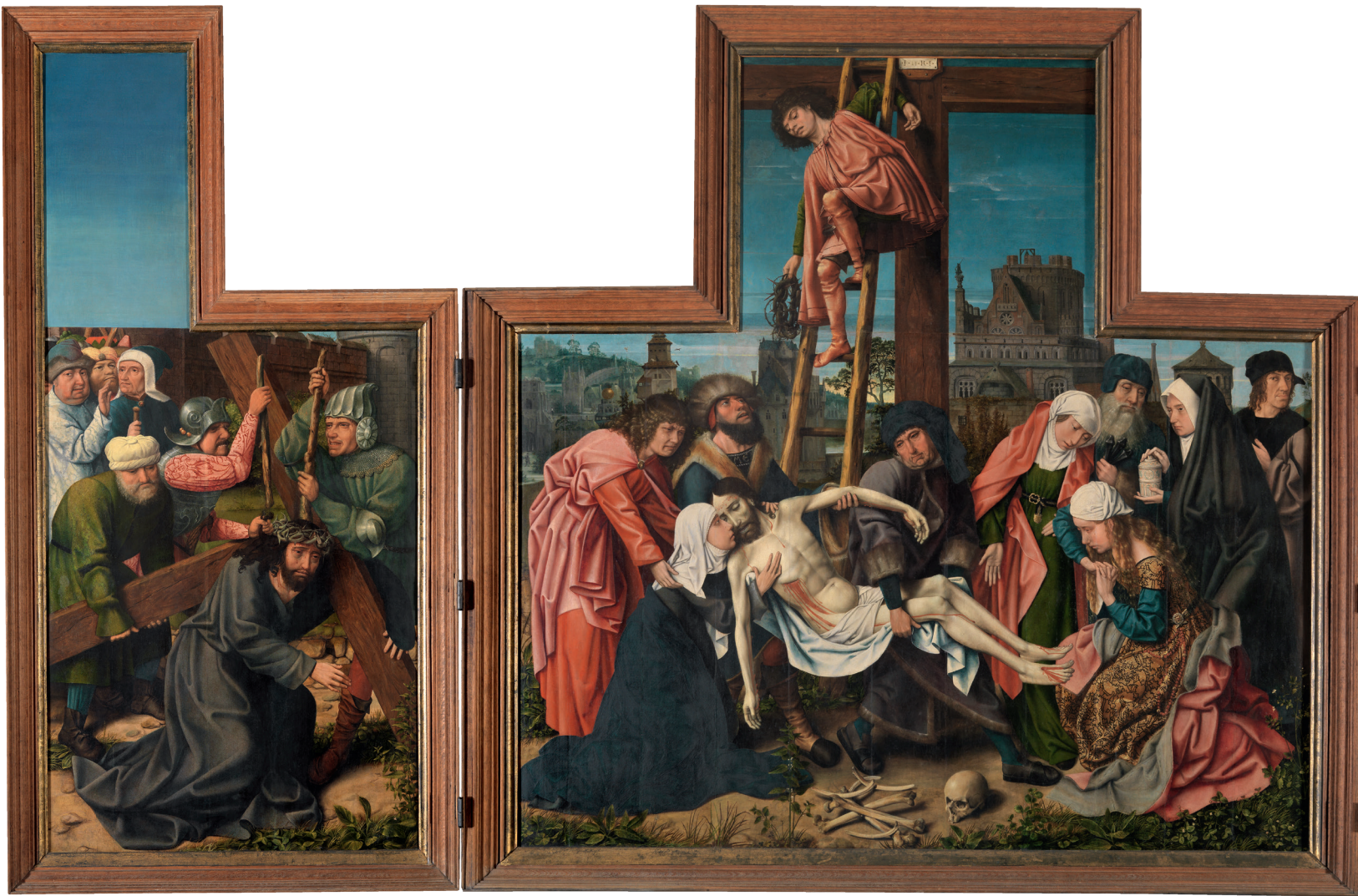
Meester van Frankfurt, Nood Gods triptiek, ca. 1515, olieverf op paneel ONZE-LIEVE-VROUW-HEMELVAARTKERK, WATERVLIED