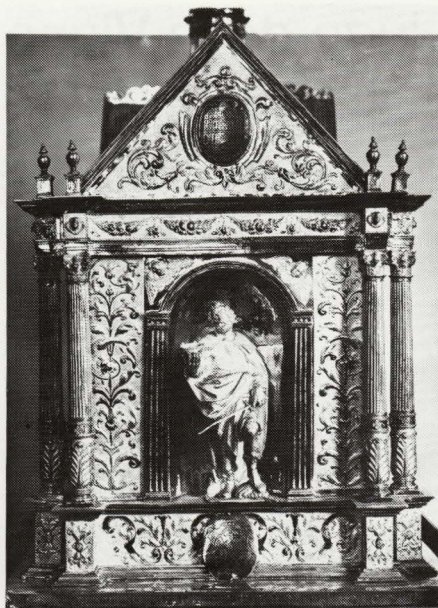
Hugo de la Vigne, De heiligen Macharius en Bavo (Zijgevels van het reliekschrijn)

tember werden de relikwieën van de H. Macharius plechtig ingehaald te Bergen. De schepenen besloten eveneens dat men een zilveren schrijn zou maken om die relikwieën in te leggen. Op dezelfde dag dat de goudsmid met het werk begon, werd geen huis meer met de ziekte besmet en werd de stad uiteindelijk in maart 1616 van die plaag bevrijd. Het reliekschrijn, dat meer dan 7000 gulden had gekost, werd op vijftwintig juli 1616 aan de bisschop van Gent overhandigd.