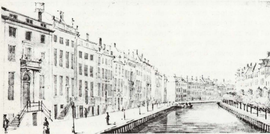
Gerrit Adriaensz. Berckheyde, Bocht in de Heerengracht te Amsterdam, tekeningen, Gemeentelijke Archiefdienst van Amsterdam

tuur. De dubbele huizen worden niet meer voorzien van topgevels, doch van rechte kroonlijsten, soms met een ballustrade en een enkele maal met beelden. Hierdoor ontstonden vierkante gevels, die doordat hun hoogte zoveel mogelijk gelijk werd gehouden een nieuw stadsbeeld introduceerden. Bovendien wordt de gevel vlakker en raken versierende elementen in onbruik. De gevel wordt slechts gelaad door de vensters, kruiskozijsen diep in het muurwerk geplaatst en daardoor werkend als grote gaten. Het ideaal van deze sobere monumentale architectuur zou echter weer spoedig verlaten worden. Daarom toont Berckheyde ons hier een zo zeldzame en haast onbekende kijk op de zeventiende-eeuwse burgerlijke architectuur.