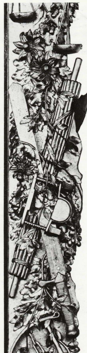
Detail opnamen van de lindenhouten lijst van dit schilderij.