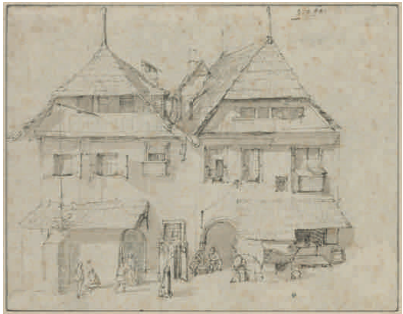
Jan Brueghel, Straat in Praag , tekening FONDATION CUSTODIA, FONDATION FRITS LUGT, PARIJS, INV. 2559

In een volgende fase van zijn carrière zal Jan Brueghel I de berglandschappen bijna volledig achterwege laten. Vanaf dan focust hij in zijn tekeningen op vlakke landschappen. Een geslaagde poging om zich te onderscheiden van de vele andere landschapskunstenaars in zijn tijd. In plaats van voor het diepe, atmosferische perspectief dat gebruikelijk was in die periode, kiest Brueghel voor vlakke vergezichten waarin horizontale lijnen domineren. Ongehinderd door obstakels op het voorplan trekt Brueghel de blik van de toeschouwer in