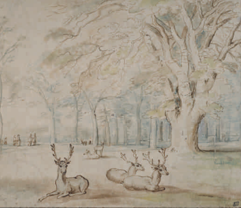
Jan Brueghel, Herten, tekening

PERSOONLIJKE STIJL Los van hun documentaire waarde, zijn de tekeningen ook simpelweg een lust voor het oog. Getekend met pen en inkt (en soms opgehoogd met aquarel), valt meteen op hoe Jan Brueghel in staat is om in zijn tekeningen evenveel accenten te leggen als in zijn schilderijen. Bovendien is het net in zijn tekeningen dat Brueghel enkele van zijn meest revolutionaire artistieke innovaties zal doorvoeren.