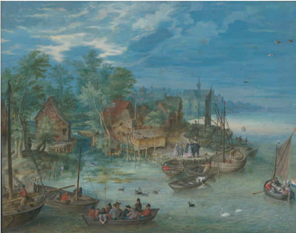
Jan Brueghel, Rivieroever met boten , gouache

STAATLICHE MUSEEN ZU BERLIN, KUPFERSTICHKABINETT, INV. KDZ 746