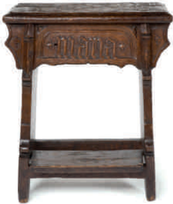
Knielbankje om op te bidden, met de namen Maria op de ene en Jhesus op de andere zijde, 1501-1525, Vlaanderen, eikenhout.

COLLECTIE GRUUTHUSEMUSEUM BRUGGE, INV. VII.O.0066