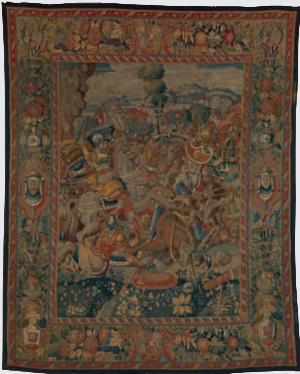
Wandtapijt met een gevechtsscène uit de oudheid, 1576-1600, Brugge, wol en zijde.

COLLECTIE GRUUTHUSEMUSEUM BRUGGE, INV. XVII.O.0003