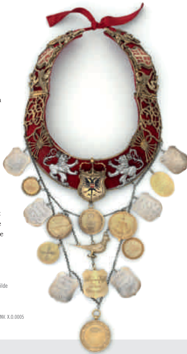
Sireschakel van de Sint-Sebastiaansgilde van Sint-Kruis, circa 1560, Brugge, zilver, messing en textiel. COLLECTIE GRUUTHUSEMUSEUM BRUGGE, INV. X.O.0005