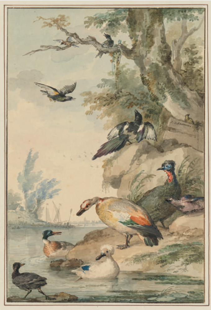
Aert Schouman, Watergezicht met vogels , 1760-1765, aquarel in diverse kleuren, over een aanzet in grafiet, 284 x 191/2 mm

KONINKLIJKE MUSEA VOOR SCHONE KUNSTEN VAN BELGIË, BRUSSEL