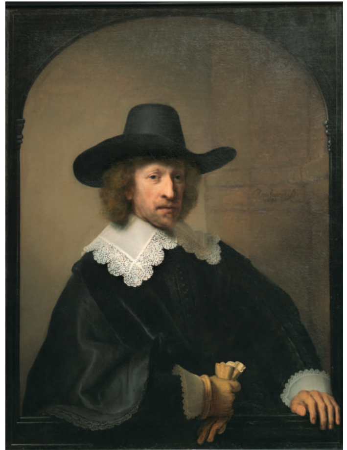
Rembrandt, Portret van Nicolaes van Bambeeck , 1641, olieverf op doek, 105,5 x 84 cm KONINKLIJKE MUSEA VOOR SCHONE KUNSTEN VAN BELGIË, BRUSSEL

In ons land bezitten de KMSKB met 320 werken de grootste en belangrijkste verzameling schilderijen uit de Nederlandse Gouden Eeuw. De kwalitatief hoogstaande deelcollectie bleef jarenlang weggestopt in de depots. Dat heeft gedeeltelijk te maken met het feit dat het museum voor de zeventiende eeuw vooral focust op kunst uit de Zuidelijke Nederlanden. Het is vooral het nijpende plaatsgebrek dat parten heeft gespeeld, terwijl een gigantische vleugel in de KMSKB leeg staat te verkommeren.