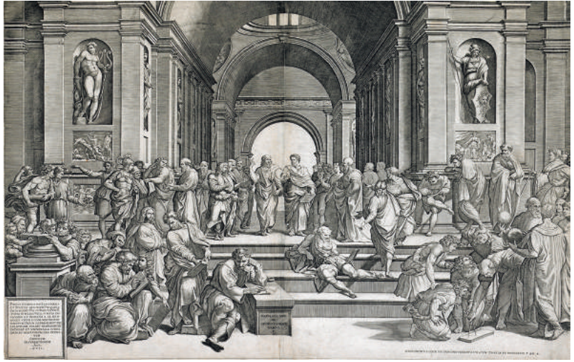
Giorgio Ghisi naar Rafaël, De School van Athene (naar het fresco in het Vaticaan), burijnggravure op twee platen, Hiëronymus Cock, Antwerpen, 1550