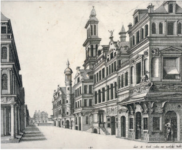
Joannes en Lucas van Doetecum naar Hans Vredeman de Vries, Imaginair gezicht op een straat met het huis 'In de vier winden' , uit Scenographiae sive perspectivae [...] , ets met burijnggravure, uit een reeks van 20 platen, Hiëronymus Cock, Antwerpen, 1560