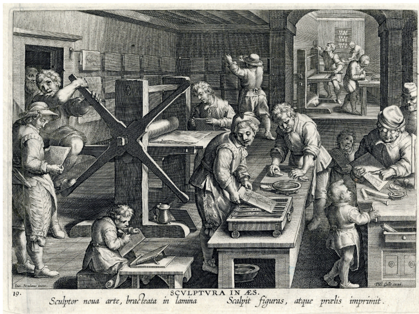
Philips Galle naar Johannes Stradanus, De graveerkunst, burijngravure , uit de reeks Nova reperta (Nieuwe ontdekkingen) samengesteld uit een titelplaat en 19 platen, Philips Galle, Antwerpen, 1591 - KBR - PRENTENKABINET, S. II 1532

vure, in 1591 vervaardigd door de prentkunstenaar Philips Galle, plaatste Stradanus de uitvinding van de graveerkunst in een rij van ontdekkingen en technologische uitvindingen die het leven van de mens ingrijpend hebben veranderd, zoals het kompas, de bril, het schilderen met olieverf, de ontdekking van Amerika en de boekdrukkunst.