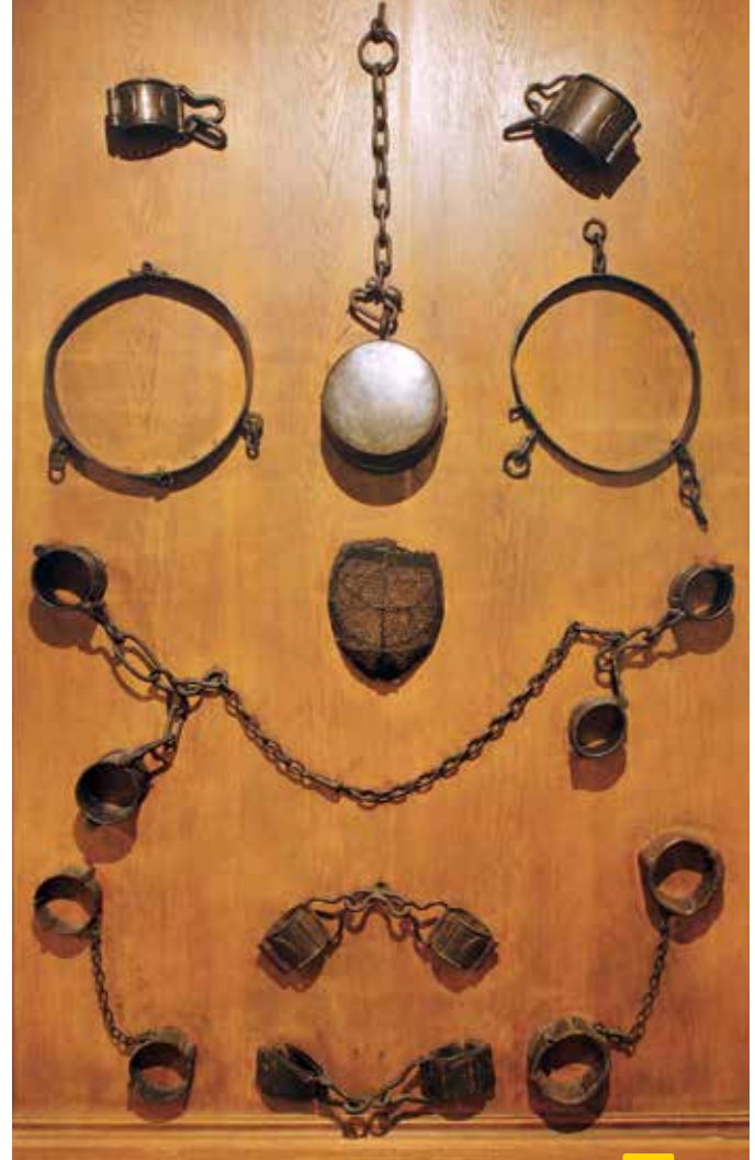
Houten paneel met de boeien van de patiënten, opgesloten in de kerkers van het Gerard

Met de komst van nieuwe medicijnen verandert opnieuw de visie op de psychiatrie en de behandeling. Samen met de antipsychiatrie in de jaren zestig kwamen ook de gebouwen zelf in het gedrang. Vele werden gesloopt of verbouwd, o ironie tot vijfsterrenhotels zoals het San Clemente-instituut in Venetië. Er kwamen meer ambulante behandelingen en kleinere wooncentra dichterbij de samenleving.