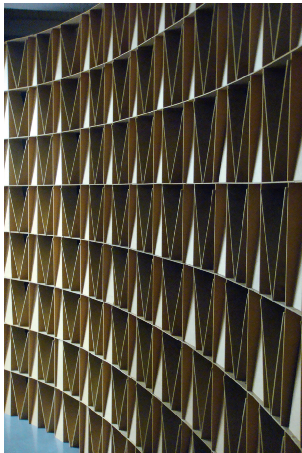
Conrad Willems, Wall of Cards , 2006, 1.700 stukken dunne MDF, elk 10 x 30 x 0,03 cm PRIVÉCOLLECTIE

In zijn vierde jaar toont Conrad Willems Wall of Cards , een constructie die bestaat uit 1.700 plankjes van 10 op 30 centimeter en een paar millimeter dik. Ze worden gestapeld zoals je doet met een kaartenhuis en kunnen dus invallen, alhoewel. Na het afstuderen volgde hij nog een jaar ‘behoudsmedewerker actuele kunst’ aan de KASK. Ook hier neemt hij initiatief en zorgt voor een boeiend bezoek aan het Reina Sofiamuseum in Madrid. Via stages in de Witte Zaal en het Delvauxmuseum