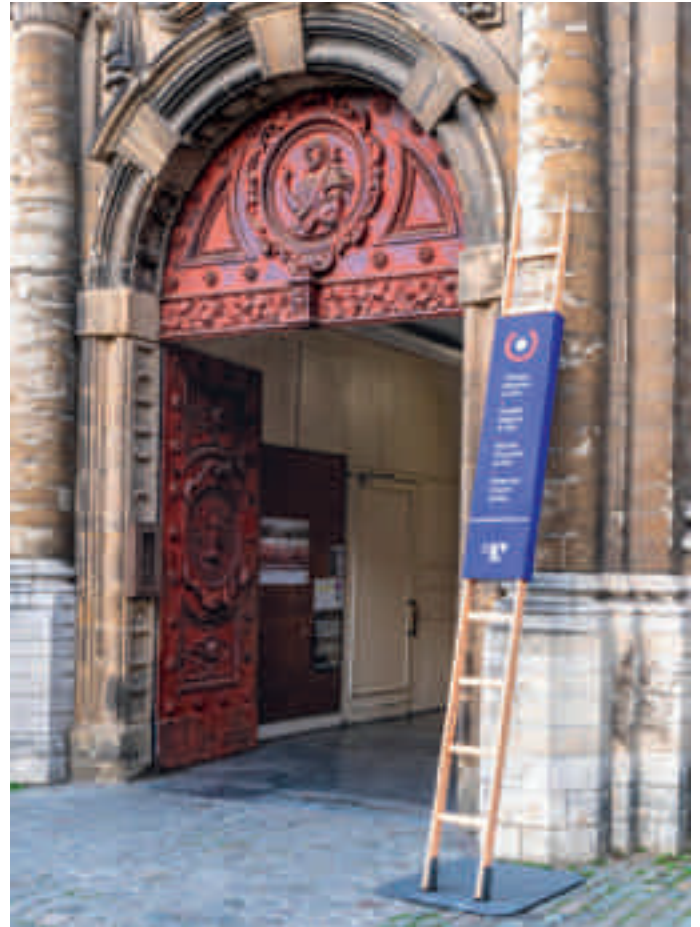
Een site met een Vlaamse Meester in Situ herken je aan de ladder aan de ingang Sint-Jan Baptist ten Begijnhofkerk, Brussel

Ruim de helft van de Vlaamse Meesters in Situ dateert van de zeventiende eeuw. Peter Paul Rubens is er uiteraard bij, in Antwerpen en in Aalst, net zoals Antoon van Dyck, in Denendermonde, Gent, Kortrijk en Zaventem. Er zijn de recent herontdekte meesters Michiel Coxcie (Brussel en Gent) en Theodoor van Loon (Brussel, Diest en Scherpenheuvel). Dat ook minder bekende kunstenaars uit de zeventiende eeuw