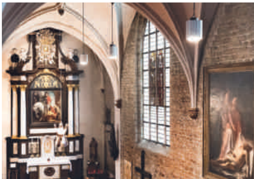
Om de stijlevolutie bij Antoon van Dyck te kunnen zien, stap je gewoon twee kerken in Vlaanderen binnen: rechts de nog Rubensiaanse Sint-Martinus (ca. 1620) in de Sint-Martinuskerk in Zaventem en links Van Dyck op zijn best in de eigen stijl met De aanbedding der herders (1631) in de Onze-Lieve-Vrouwekerk in Dendermonde

gerestaureerd, zodat ze zich op hun best aan de bezoekers kunnen tonen. Met geestdrift bieden ze een hele waaier activiteiten aan die hun Vlaamse meester in de verf zetten: themawandelingen, rondleidingen, concerten, lezingen... Alle informatie hierover en ook over de uitgestippelde routes en de openingsuren van de sites vind je op www.vlaamsemeestersinsitu.be . De website bundelt eveneens alle informatie, inclusief audioverhalen en filmpjes, die op de 45 aanraak-schermen bij de kunstwerken te vinden is (zie blz. 31). En er is ook nog een boek, een extra gids die je op je tocht langs Vlaamse Meesters in Situ begeleidt. Daarvan verschijnen twee versies: een 'gewoon' boek, waarin de kunstwerken zijn afgedrukt, en een stickerboek, waarin de reproducties van de werken dienen gekleefd te worden. Iets heel speciaals zijn de 'wrijf & ruik' -prenten in het boek (zie blz. 28).