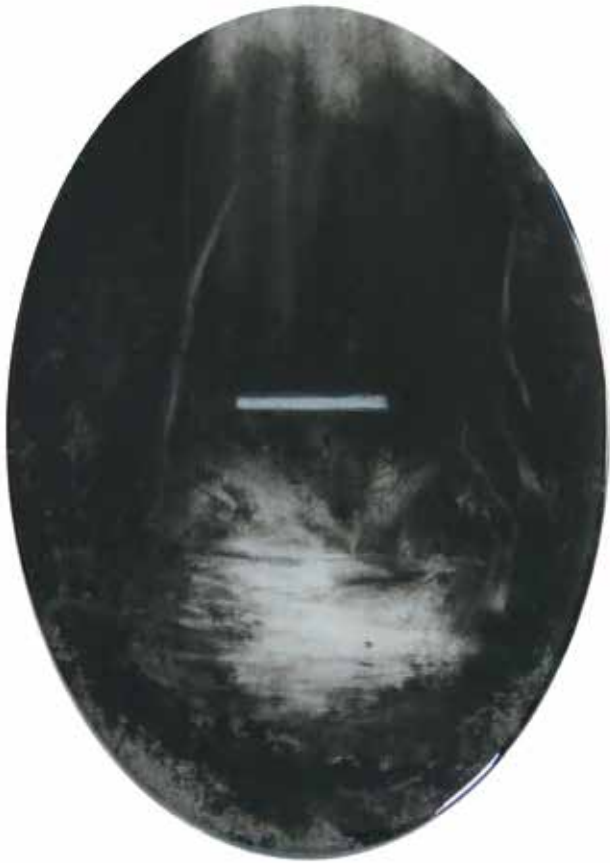
Kevin Vanwonderghem, [zonder titel], 2016, houtskool op papier, 17 x 24 cm

“Het gaat om romantiek, de elementen in de natuur waarop de mens eigenlijk geen greep kan hebben.