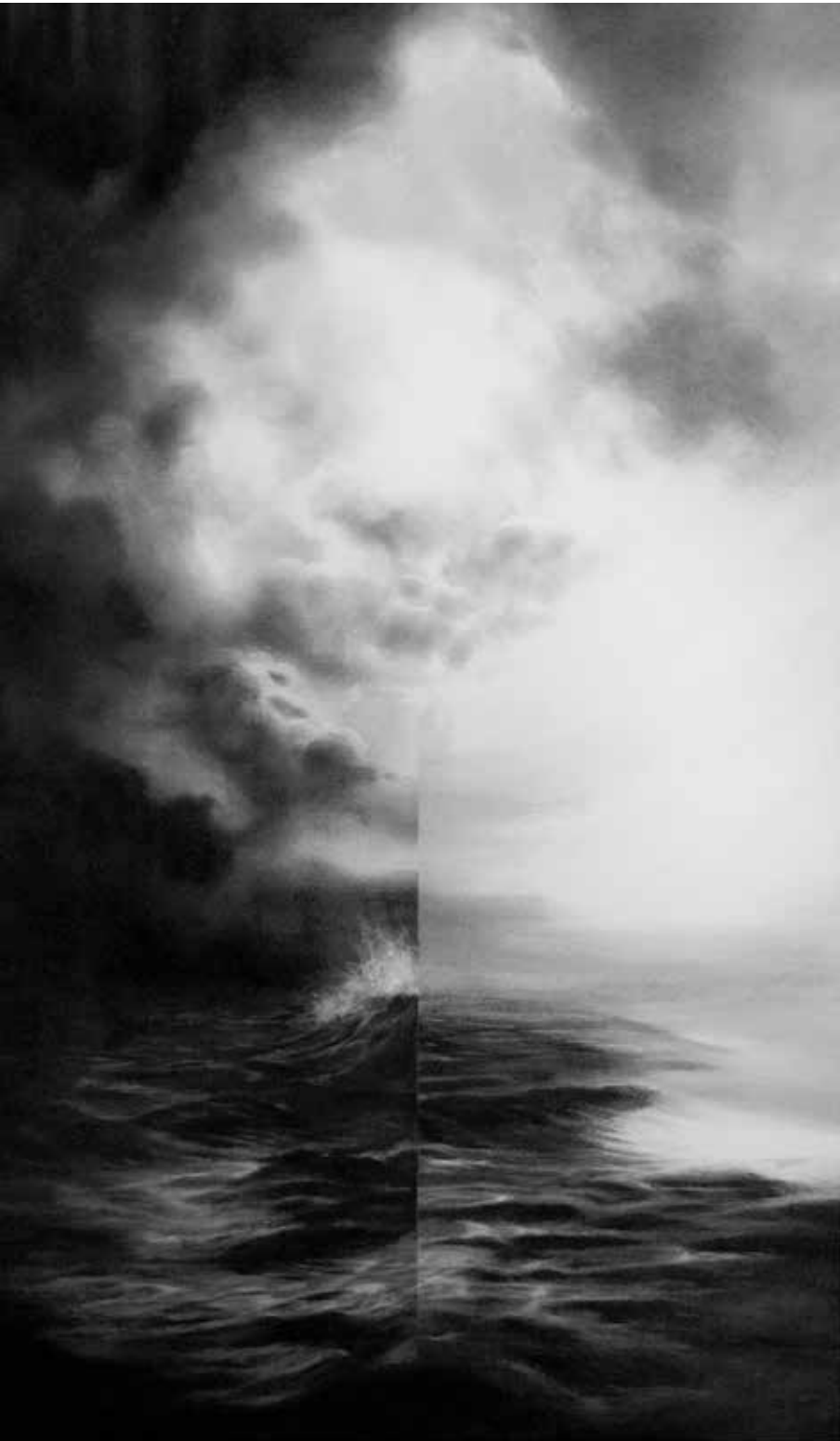
Kevin Vanwonterghem, [zonder titel], 2019, houtskool op papier, 120 x 70 cm

betoverd naar de pracht van de onderwaterwereld aan het kijken, naar dat ogenschijnlijk harmonieus samengaan van tal van organismen. En toen werden we er attent op gemaakt dat de tank gevuld was met kunstmatig geproduceerd zeewater.” En hij maakt een link met de schilders uit de Romantiek. “In hun atelier brachten zij de losse observaties en schetsen samen om tot een subliem landschap te komen. Zo ben ik nu bezig met het assembleren van diverse landschapselementen. Het artificiële karakter wordt een belangrijk onderdeel van het beeld, het sublieme wordt verstoord.”