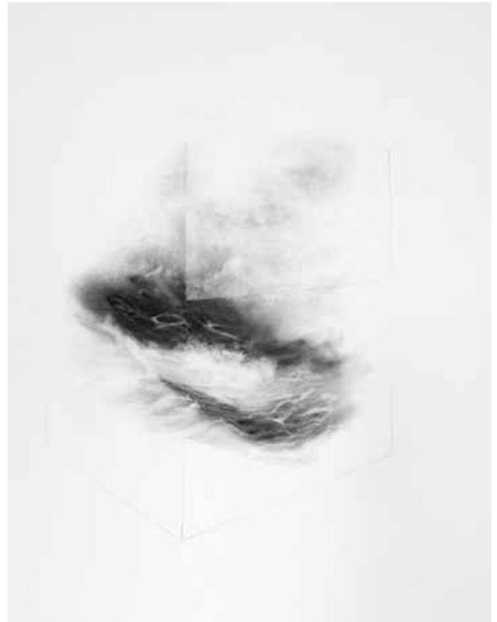
Kevin Vanwonterghem, [zonder titel], 2016, houtskool op papier, 108 x 78 cm 8 x 13 cm

Hij verwijst naar de Franse barokschilder Claude (Le) Lorrain of Claude Gellée (1600-1682) die, na zijn terugkeer in Frankrijk, zich vooral heeft toegelegd op het schilderen van paradijselijke landschappen, sterk geïdealiseerd en gekenmerkt door een suggestie van grote diepte en vergezicht. In de landschappen van Claude Lorrain is het licht altijd van zeer groot belang. De zon is niet steeds zichtbaar aanwezig, maar het zonlicht is dat wel en speelt een belangrijke en intensifiërende rol en wordt dikwijls versterkt door reflecterende waterpartijen.