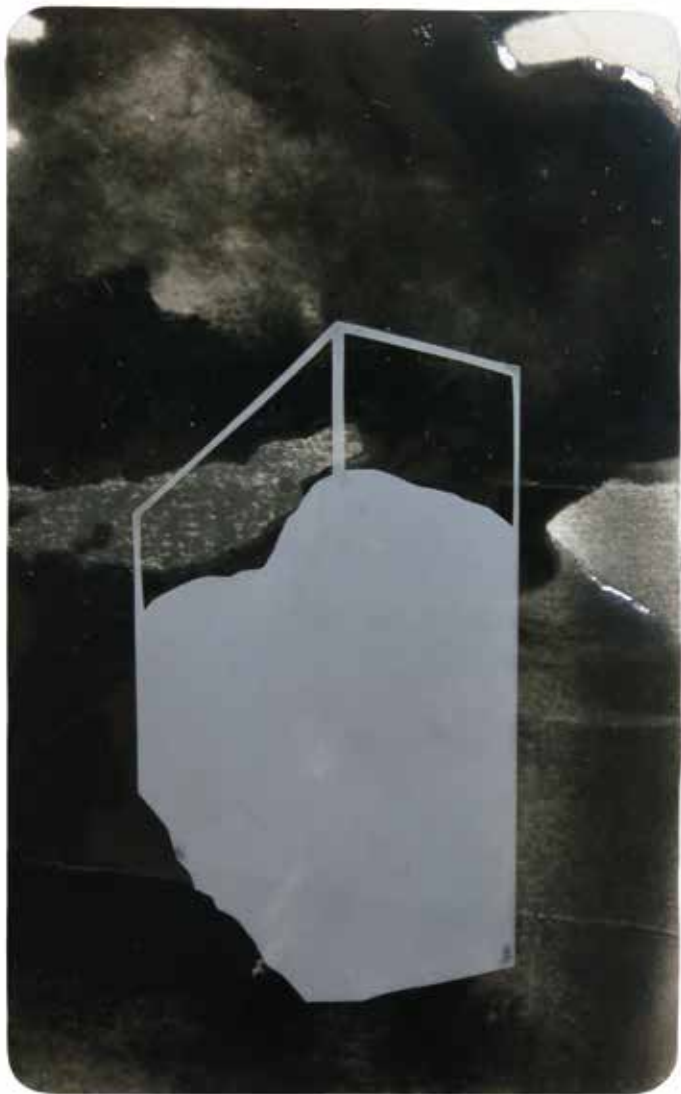
Kevin Vanwongerghem, [zonder titel], 2019, houtskool en acrylhars op papier, 8 x 13 cm

Het is ook naar deze schilder dat de zogenaamde claudespiegel is genoemd. De miroir de Claude of Claude glass (ook als black mirror aangeduid) was zeer geliefd bij achttiende-eeuwse schilders. Het is een draagbare, enigszins gebolde spiegel met een zwarte achtergrond. Als je met je rug naar een te bewonderen landschap staat, zie je in de spiegel een breed panorama. Je ziet de grote lijnen, minder de detaillering, en getemperde kleuren. Het biedt een mooi overzichtelijk geheel en was destijds niet alleen bij de kunstenaars maar ook bij toeristen een geliefd hebbeding. Ze konden er de natuur in bekijken zoals ze die graag wilden zien. Door de spiegel te gebruiken kan je delen van het landschap in de spiegel isoleren, niet gehinderd door storende elementen in je gezichtsveld. Het gebruik ervan laat je toe om te idealiseren.