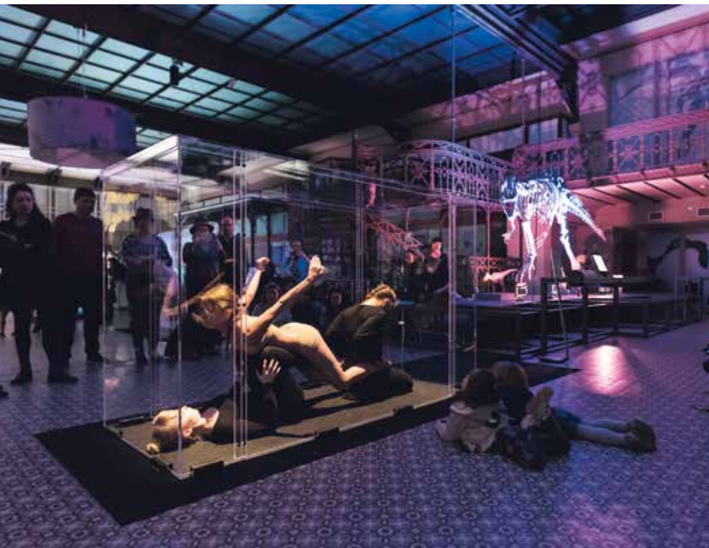
Tuur i.s.m. Flup Marinus, Still Animals op Nuit Blanche, 2016, in het Museum voor Natuurwetenschappen in Brussel