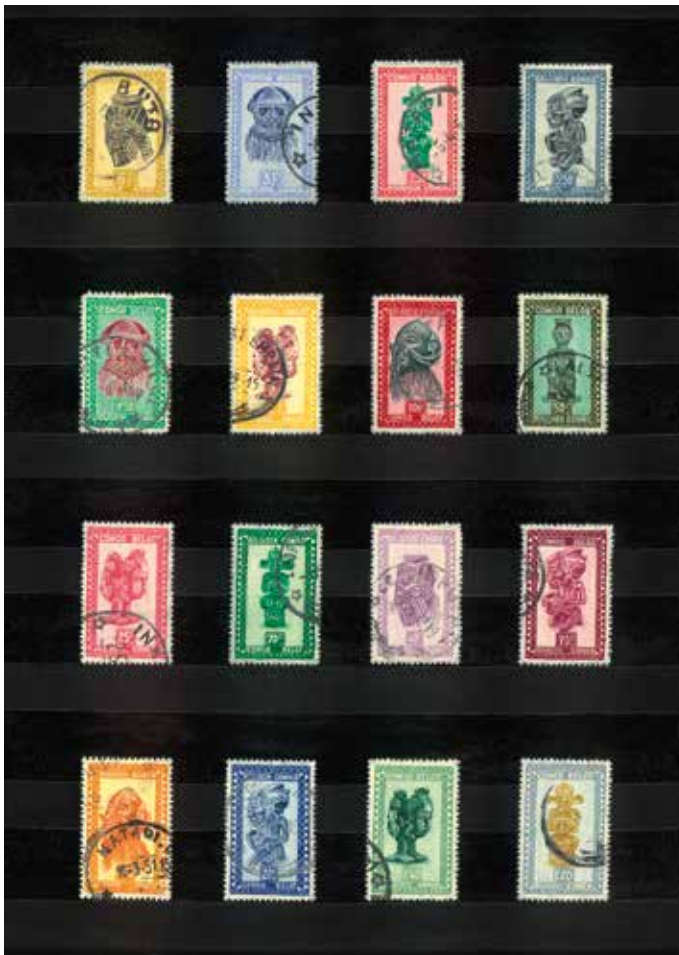
Tuur & Flup Marinus, Belgisch Congo Belge , blz. 10

“De vondst van de verzameling postzegels van Belgisch Congo bezorgde mij een schok: het gaat om prachtige, esthetische beelden, maar ook om het besef dat achter die kleurenrijkdom een waanzinnig duister verhaal schuil gaat.