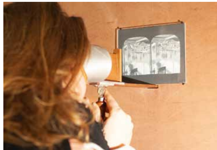
Een bezoeker kijkt naar een Stereoscoop -schilderij via een stereokijker