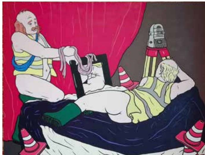
Flup i.s.m. Tuur Marinus, Venus , 250 x 190 cm, op Antwerp Art Weekend, 2019

Tuur: “Door mijn schilderopleiding ben ik getraind om naar materiaal te kijken met de blik van ‘zit hier een interessant beeld in om te schilderen’. Op een dag kwam ik op zolder in het ouderlijk huis een postzegelalbum tegen waar wij als kinderen heel veel mee bezig zijn geweest. We hadden een hele verzameling postzegels van Belgisch Congo, dat was een beetje een familiestuk, de oom van mijn vader was missionaris in de kolonie en uiteraard werden de postzegels van alle brieven die toekwamen zorgvuldig losgeweekt en bij de verzameling gevoegd. De vondst van het album bezorgde mij een schok: het gaat om prachtige, esthetische beelden, maar ook om het besef dat achter die kleurenrijkdom een waanzinnig duister verhaal schuil gaat. Het is iets wat je als kind niet ziet, maar als jong volwassene wel.” Het is een kritische houding die toch wel mede gevormd is door de opleiding bij PARTS, waar hij onder meer filosoof Lieven De Cauter (°1959) als docent had, een man die hem nog steeds sterk inspireert. Tuur heeft eerst een potloodschets gemaakt van een blad uit het album en uiteindelijk is vanuit gesprekken en discussies beslist om samen met broer Flup dit project op te zetten. Het heeft in totaal ongeveer zeven jaar in beslag genomen, uiteraard met veel tussenperiodes waarbij aan dansproducties gewerkt moest worden.