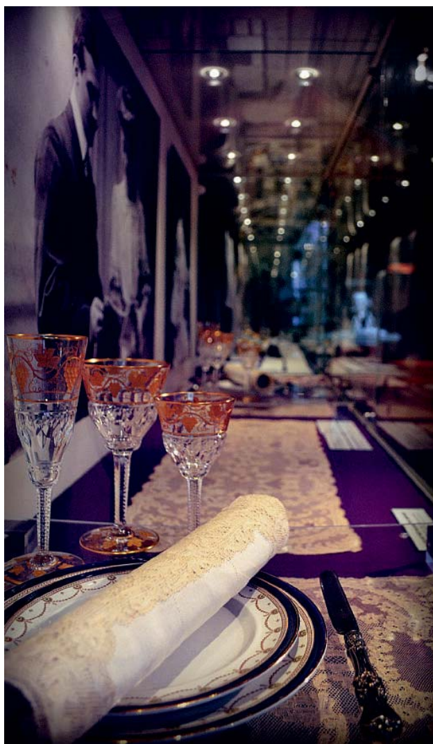
Op de zolder krijgen de Turnhoutse kantwerksters een stem [rechts boven] Het Kabinet Taxandria biedt een mooi overzicht van de museumcollectie [rechts onder] Gastheer 'de archeoloog' toont zijn vondsten

Als de Nederlanden zich weer zouden verenigen, dan ligt Turnhout centraal, zoals in de tijd toen de hertogen van Brabant hier hun jachtcentrum hadden. Toch dankt de streek haar bijzondere geschiedenis ook aan haar perifere ligging. Dat komt u te weten in Hotel Taxandria.